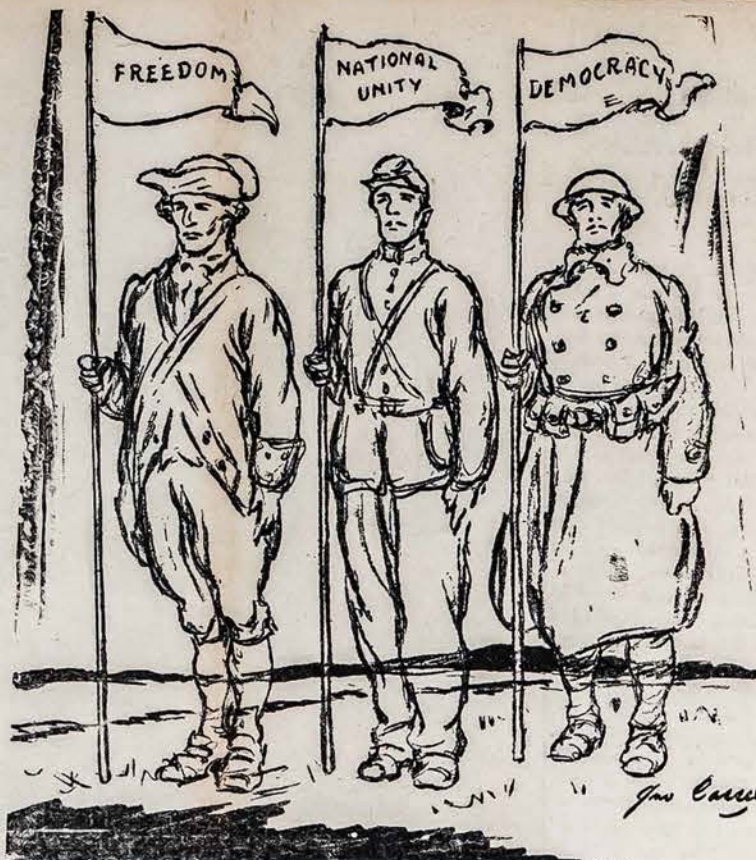
Del ko jie Mirė! DEL LAISVĖS, TAUTINĖS VIENYBĖS IR DEMOKRATIJOS