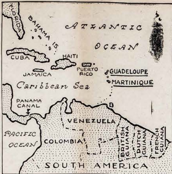
PERDAUG ARTI PANAMOS KANALO

Bolševikai sovietinėje Lietuvoje buvo paskelbę mobilizaciją, kad paimti visus jaunuolius ir sovietų kariuomenę, gimusius 1905 ir iki 1918 metų.