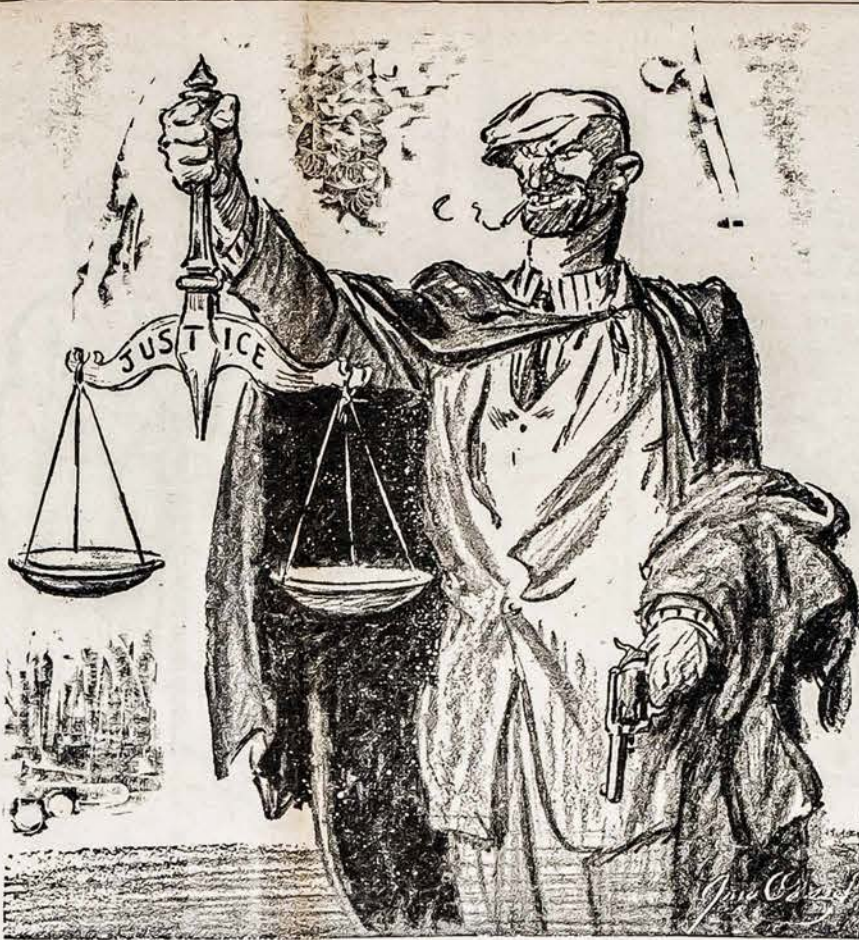
Mūsų Naujoji Emblema TEISINGUMAS, PAREMTAS MAUZERIO SUVIU