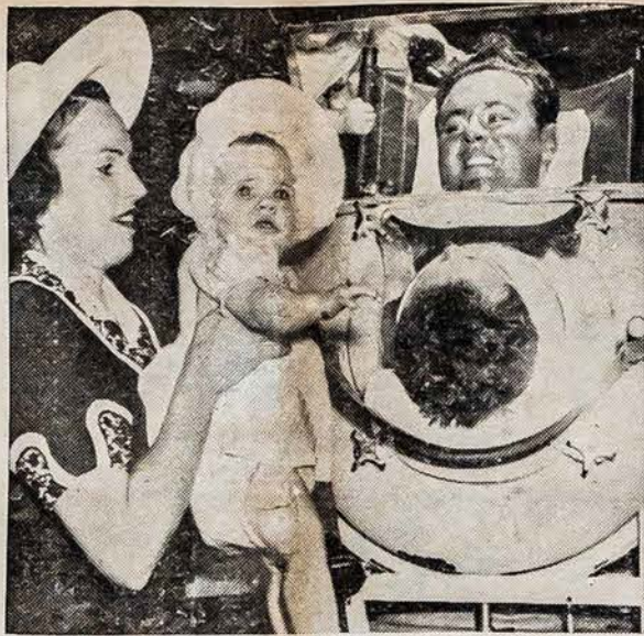
BOILERIO TĖVAS IR JO DUKTĖ

NEPAPRASTAS PIKNIKAS Piknikas, kurį rengia Lietuvių Sveikatos Kultūros Draugija įvyks sekmadienį, liepos-July 13, 1941, Lietuvių Parke, Chestnut Hill Lakewood, Waterbury, Conn. Bus graži programa pagiriuose, bus kalbų, dainų, žaidimų, naujausių tik ką iš Lietuvos šokių ir t.t. Taipgi turės skanių užkandžių ir gėrimų.