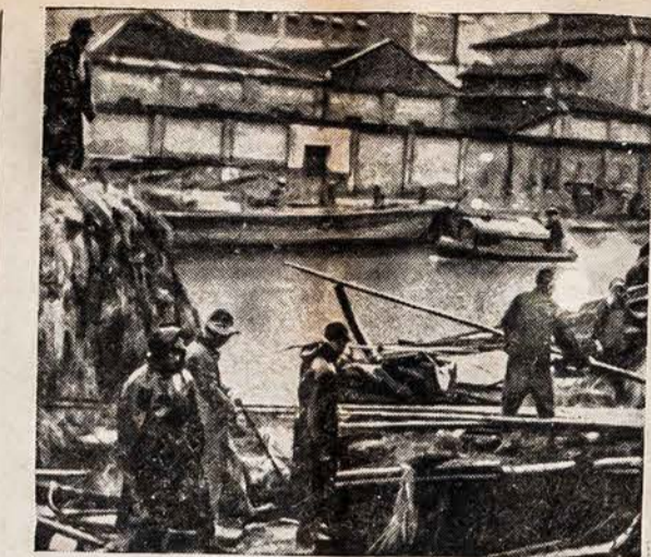
IESKO KINIEČIŲ TERORISTŲ

8. Maskva savo ultimatumu statė ne du, kaip vienas kitas pašneka, o tris reikalavimus. Vienas jų buvo pakeisti Ministrų Pirmininką tokiu žmogum, kurs būtų "priėmliis" Maskvai (ne palankus, kaip kas pasakoją). Prezidentas, patiriamas Ministrų, sutiko tą reikalavimą svarstyti, tačiau ta prasme, kad Ministras Pirmininkas visų pirma jam, Prezidentui, būtų "priimtinus", taigi ir sustoję ties gen. Raštikio kandidatura, visai nesiklausdamas prieš tai, ar Maskvai bus "priėmliis". Mat buvo viešumos nuomonė, jog susikirtus su Maskva, nė esamasis Min. Pirmininkas, nė jo Taryba nebegalų palikti. Kitų dviejų reikalavimų Prezidentas visai nesvarstė jo pirmininkaujamame Ministrų Tarybos posėdyje, pareiškęs, kad jie visi priešingi Konstitucijai, nesuderinami su 1939 m. Maskvos sutartimi, nė su lietuvių tautos valia. Vadinasi neteisinga ir ta žinia, kuri skelbia, jog Prezidentas ir jo Ministrų Taryba priėmė Maskvos ultimatumą. Maskvos ultimatumo negalėjo ir nepriėmė Respublikos Prezidentas Smetona. Juo labiau to ultimatumo negalėjo priimti Prezidento pavaduotojas Merkys: ultimatu-