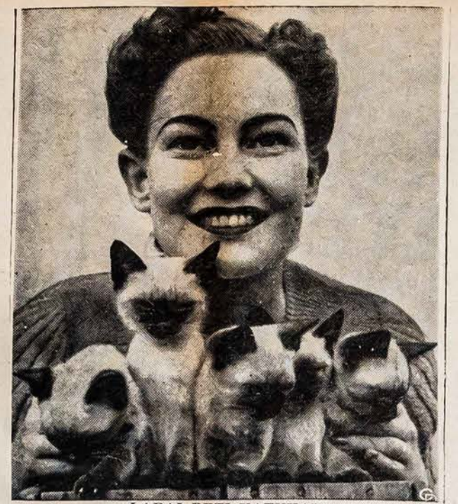
LABAI RETI KATUKAI