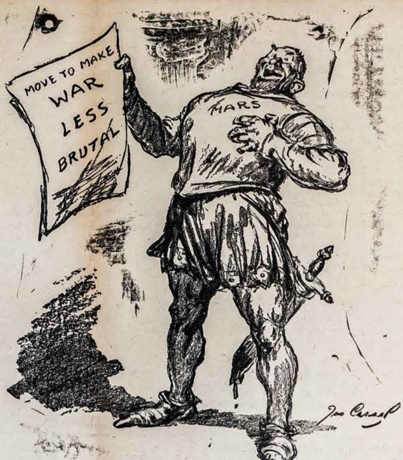
NEJUOKAUKE! INESU SUMAZINTI KARŲ BRUTALISKUMĄ — MARSAS

Dabartiniu metu bolševikai tokiems asmenims neleidžia išvažiuoti iš okupuotosios Lietuvos ir taip pat kliudo susisiekti su Amerikos Ambasada Maskvoje, neduodami leidimo į Maskvą nuvažiuoti. Pasirodo, kad bolševikai panašiai elgiasi ir su lenkais Ameri-