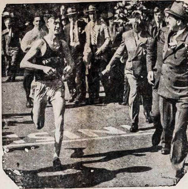
LAIMEJO TREČIA KARTĄ

Be to, valdymo tvarka eidama, jis yra Vyriausias Ginkluotųjų Pajėgų Vadas (135 str.), jis skiria ir atleidžia Kariuome-