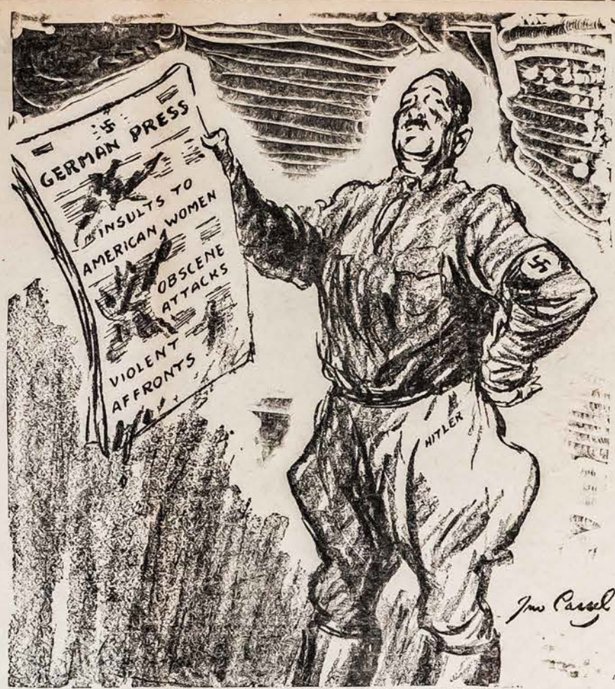
"MES TAIPGI TURIME SPAUDOS LAISVĘ"

Socialistai, komunistai, krikdėmai, dabar žino, kad Amerikoje yra Lietuvos aukso, tai jie mat bando sudaryti kokį nors kuną, su kurio pagelba, gal jie gautų tą kapitalą sau ant pašaro. Juk visuomenė, jiems į fondus pinigų beveik neduoda ir net krikdėmai verkia "jaučio ašaromis", kad negauna pinigų. Tačiau, vargiai jie atsieks to tikslo, visuomenė juos pažinstą visus ir žino ką laike pasaulinio karo jie su aukomis darė — jie atskaitų neišdavė. Bendrovių, organizacijų, "ukininkų sąjunga Aleksote", "lašinių skutimo by-la" ir kiti prašmatnumai, dar rugsta, juos visuomenė užuodžia. Todel ir aukų jiems neduoda, jie aukaus Lietuvai, kada patys galės jai pasiūsti ir ją paremti, bet politikieriai pinigų negaus!!!