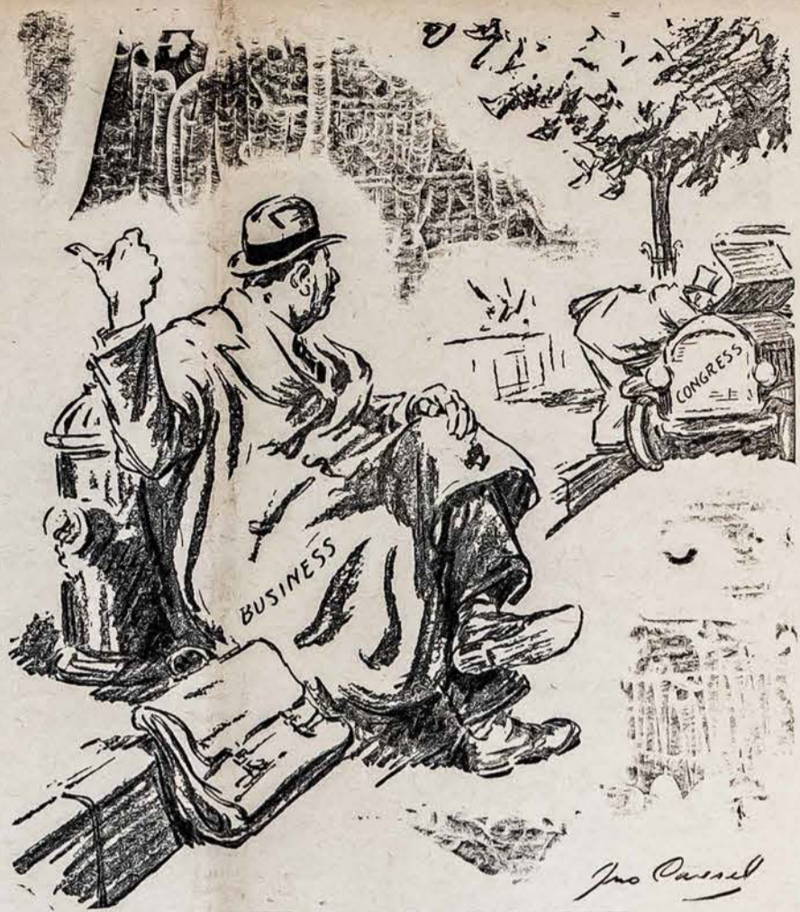
BIZNIS LAUKIA KONGRESO, KAD JĮ PAVEŽTŲ