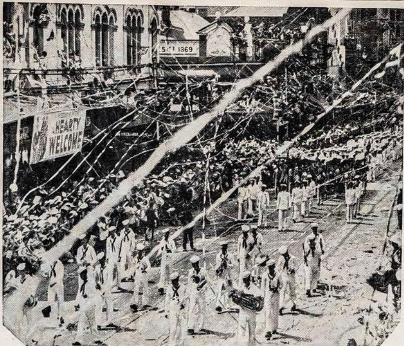
AUSTRALIJA PRIĖMĖ S. V. JUREIVIUS Brisbane, Australijoje, iškilmingai papuošose gatvėse su žvaigždėmis ir dryžuotomis vėliavomis buvo priimti S. V. jureiviai, kurie čia sustojo pasisvečiuoti savo pratimų skvadronuose su septyniais kariškais laivais.