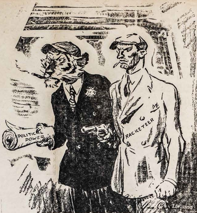
DU PANASŪS VIENAS KITAM

Gauta žinių, kad raudonoji Lietuvos valdžia išleido visą eilę naujų įsakymų, kuriais ukiniškai verčiami dėtis į sovietiškos baudživos kolchozus. Butent, jau nuo šių metų derliaus nustatyti javų, šakniavaisių ir kitų kultūrų kiekiai, kuriuos ukininkai privalomai turi pristatyti valstybei. Tie kiekiai nustatyti tokiu budu, kai ukininkai, nesideda į kolchozus ir nesinaudoja sovietiškais traktoriais, turės valstybei pristatyti daugiau javų ir šakniavaisių, negu kolchozininkai. Pav. ukiai, turi daugiau kaip 25 hektarų, turės pristatyti net iki 6 kartų daugiau, negu ukiai iki 5 hektarų. Visomis tomis priemonėmis, apie kurias smulkiau pranešime, siekiama vieno tikslo: kolchozų baudživos!