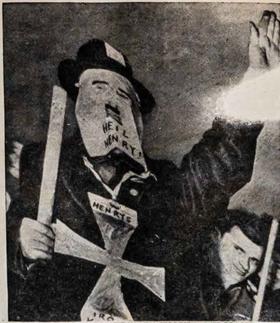
FORDO DARBININKAS PAJUOKIA MILIJONIERIŲ

Po koncerto choristai Worcesteriečiai, New Britainiečiai ir