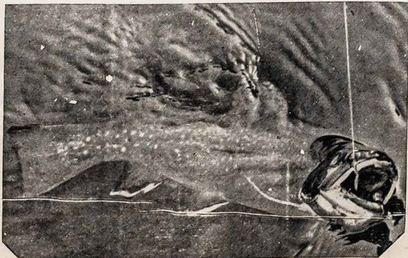
MESKERIOJIMO SEZONUI PRASIDĖJUS Čia matome margąjį vašilą (trautą), kovojantį su meškere del laisvės. Tačiau po 12 minutų 20 colių ilgio trautas buvo žuvininko nugalėtas.