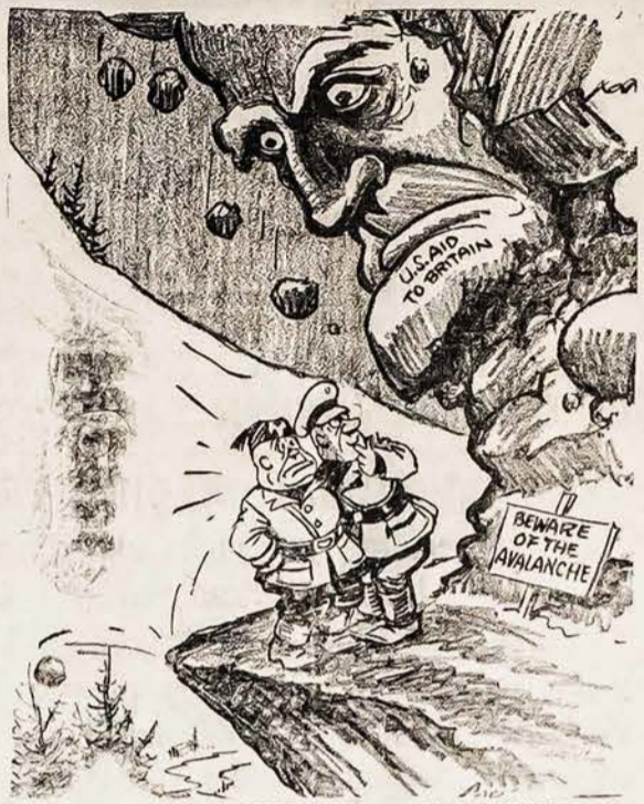
BRENNER PARĖJIMAS — 1941 METAIS

Pasitenkindami gyvenimu, taip kaip jis yra, nieko nesvajodami, nemąstydami, neplanuodami, žinoma niekuomet nieko ir neatsieksime. Jei sakysime — kas man darbo su progresu. Aš turiu dirbtuvę darbą, užsidirbiu pakankamai, kad pragyventi, tai kam dar man siekti, kvairšinti galvą kokiomis svajonėmis. Taip galvodami, aišku niekuomet nieko svarbesnio savo gyvenime nenuveiksime ir jokio progreso neatsieksime.