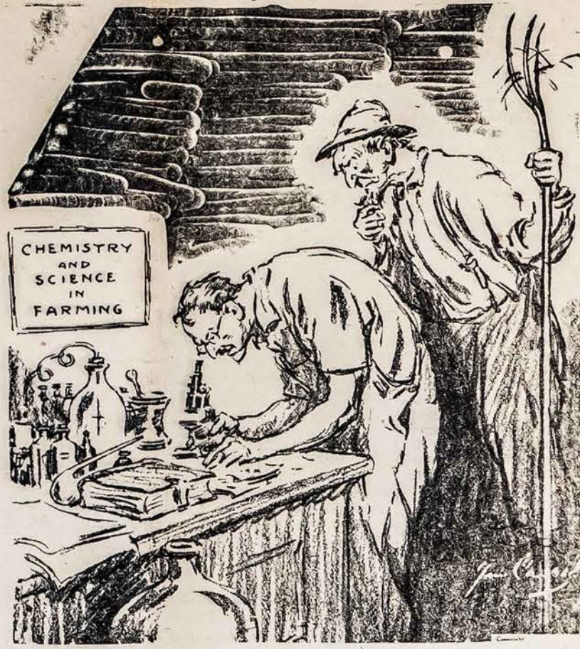
KEMIJS MOKSLAS APIE UKININKYSTĘ