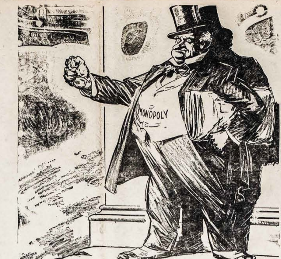
EIK ŠIA, TU! AR VISI... TA UOLA SKILS NUO SAVO KAMIENO KAIP GREIT AŠ JĄ STUKTELSIU, — ŠAUKIA MONOPOLIS.

Šita gramatika daugiausiai taikoma del žmogaus jaunimo, kad galėtų tinkamai savo tėvų kalbą išmokyti su anglų kalboje pateiktais paaiškinimais. Todel patartina kiekvienam čia gyvenusiam jaunui ir jaunuoliai šią gramatiką įsigyti. Išigyti, busite patenkinti, kad greitai išmoksitė taisyklingai lietuviškai skaityti ir rašyti sulęg šioje gramatikoje pateiktų taisyklių.