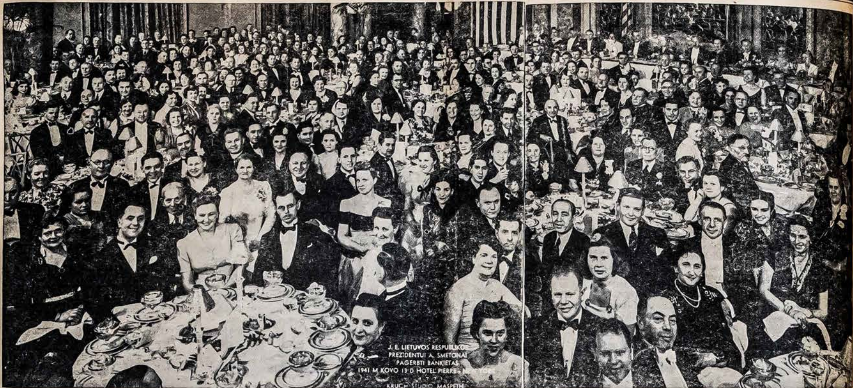
J. E. LIETUVOS RESPUBLIKOS PREZIDENTUI A. SMETONAI PAGARBŲ BANKIETAS 1941 M. KOVO 13 D. HOTEL PIERRE