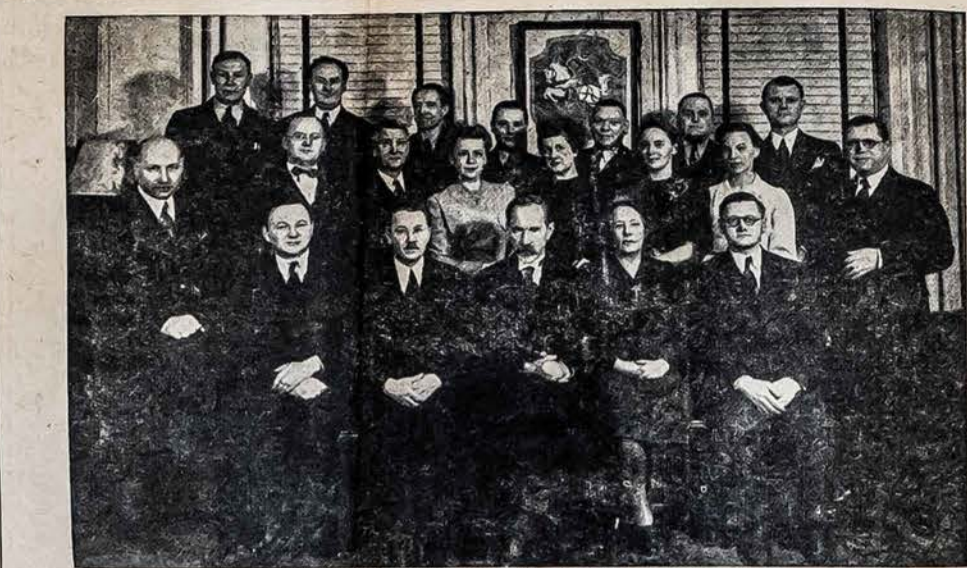
LIETUVOS PREZIDENTUI PRIIMTI KOMITETAS

Dar prieš atvykstant Prezidentui iš Pietų Amerikos, vasario 15 d. š. m. aš rašiau toje linkmėje, kas turėtų sudaryti Lietuvos Valdžią, tad pakartoti savo nuomonę nematau reikalo, tik prie šios progos noriu pridėti tai, kad mums nereikalinga nei kalbėti apie sudarymą provizionals valdžios. Tai būtų didelė klaida, jau tuomi pačiu faktu parodytume, kad mes nepripažįstame mūsų dabartinės valdžios, o tik to ir laukia mūsų priešai. Čion dabar yra Lietuvos Prezidentas, Ministeris p. P. Zadeikis, ir daugiau atvažiavusių aukštų Lietuvos valdininkų, reikalinga tik susikuopti kruvon ir paskelbti Lietuvos Valdžios kaipo trem-