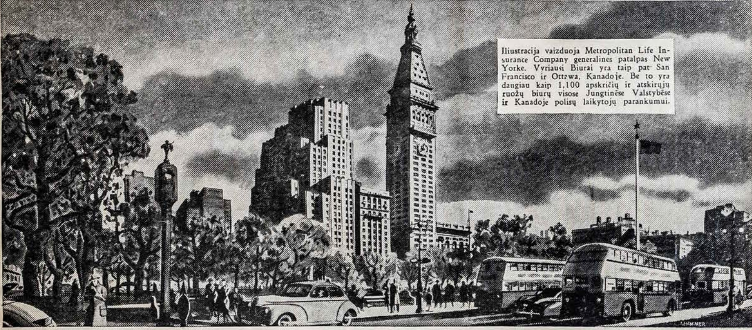
Ilustracija vaizduoja Metropolitan Life Insurance Company generalines patalpas New Yorke. Vyriausii Biurai yra taip pat San Francisco ir Ottawa, Kanadoje. Be to yra daugiau kaip 1,100 apskričių ir atskirųjų ruožių biurų visose Jungtinėse Valstybėse ir Kanadoje polisų laikytojų parankumui.