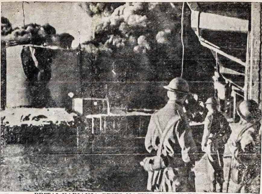
BRITAI KARIAUJA PRIEŠ NACIUS ARTI NORVEGIJOS Anglų ir Laisvų Norvegų jėgos narsiai užklupo nacių užgrobtas Lofoten salas, netoli Norvegijos, paskandindami vienuolika vokiečių laivų, paimdami 225 belaisvių ir sudegindami chemikos dirbtuvę.