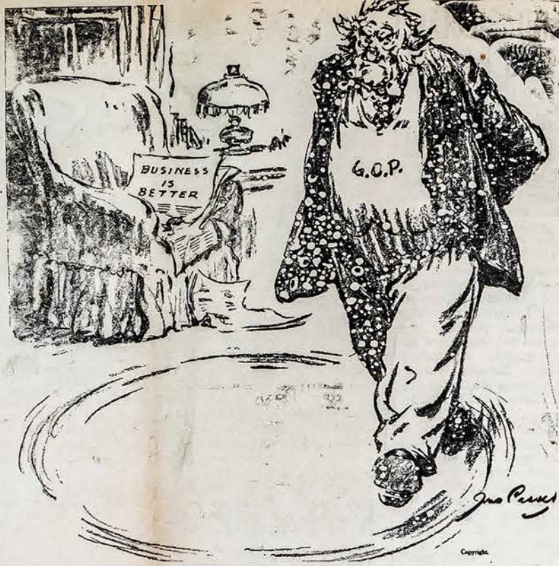
"AŠ VISTIEK ABEJOJU APIE KONSTITUCIJĄ"

Euripidis nusiminusiems nurašina: "Blogiausiuose nepasiekimuose visada yra gopa laimingiausiai permainingai."