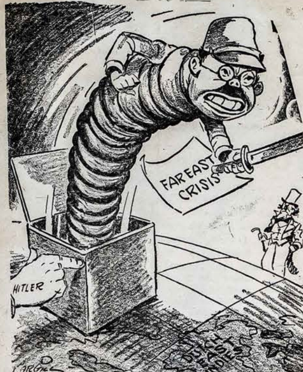
Magiškas Hitlerio piršto paspaulimas parodo, kaip greitai gali Japonas išsokti iš dėžės, ir parodyti Dėdei Siamui savo galybę Tolimų Rytų Kinijos ir kitų kolonijų klausimose.