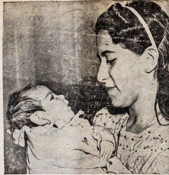
KUBOS PREZIDENTO DUKTERYS