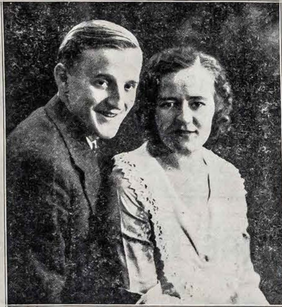
A. ir B. Sintautai solistai

Lietuviška Mokykla ir Jos Įtaka Tenka pažymėti faktą, kad SLA. Liet. Kalbos Kursų mokyklų veikla Conn. valstijoje lošia svarbią rolę mus tautinės kultūros plėtojimo darbe.