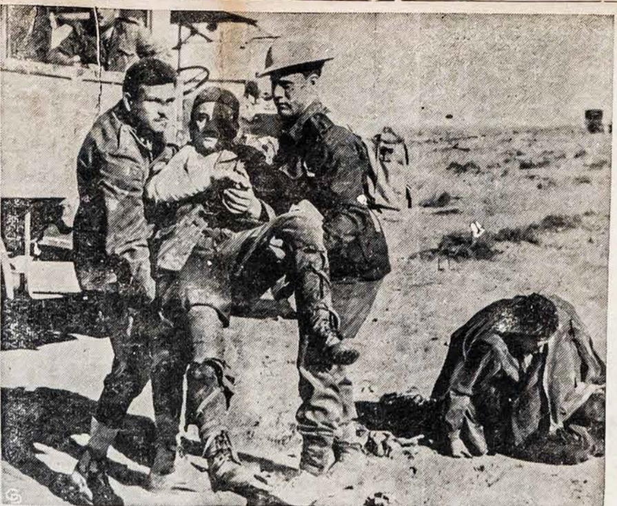
NELAIMĖJE PRIEŠAI SUSIDRAUGAUJA IR VIENAS KITAM GELBSTI Britų karininkas padeda italui nelaisviui nešti sužeistą italą kareivį į ambulansą, kad nuvežti jį į ligoninės stotį, po Britų pergalės ant Tobruk, Libijos prieklauskos. Kitas sužeistas italas ant žemės laukia pagalbos.