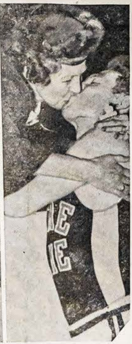
RICE NUSTATĖ TRIJŲ MYLIŲ REKORDĄ Gregory Rice, neseniai baigęs Notre Dame universitetą, lenktynėse nustatė naują pasaulio trijų mylių rekordą - 13:51, A. A. U. Atletų rungtynėse New Yorke. Jo motina iš džiaugsmo pabučiavo jį. Rice taipgi sumušė 2 1/2 ir 2 3/4 mylių rekordą.

Svarbiausias įrodymas, kurs eina demokratijos sąskaiton yra tas, kad demokratinė tvarka žmonės yra gudresni, išmintingesni. Tas paeina nuo to, kad žmonės gali liusiai pareikšti savo mintis. Pavyzdin mes galim susirinkti, ginčytis, diskutuoti įvairius politinius ir ekonominius klausimus, be jokios baimės būti įtartais kokiame nors prasižengime prieš valdžią. Rusijoje, Vokietijoje, Italijoje to daryti ne-drįstume. Ten tiktai gali kalbėti ir girt tą partiją, kuri yra valdžioje.