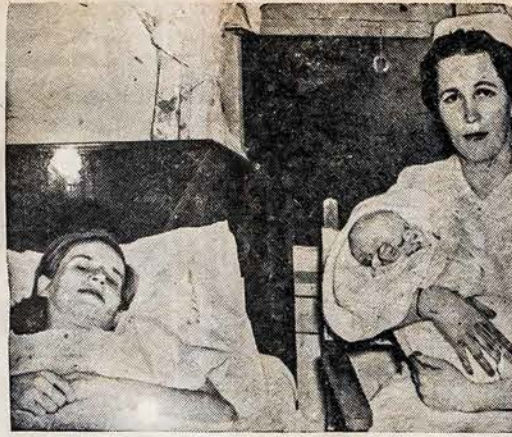
BEGIMSTANTIS KUDIKIS PRAPUOLĖ