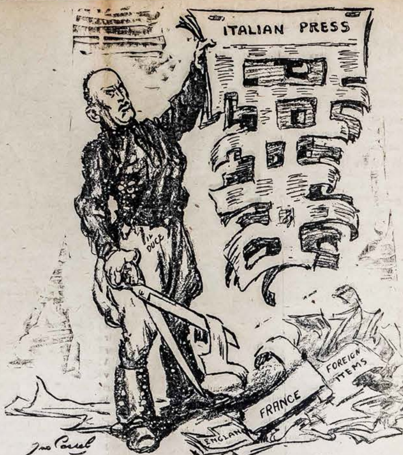
Nubausti Pasaulis! - Šaukia Italų Spauda