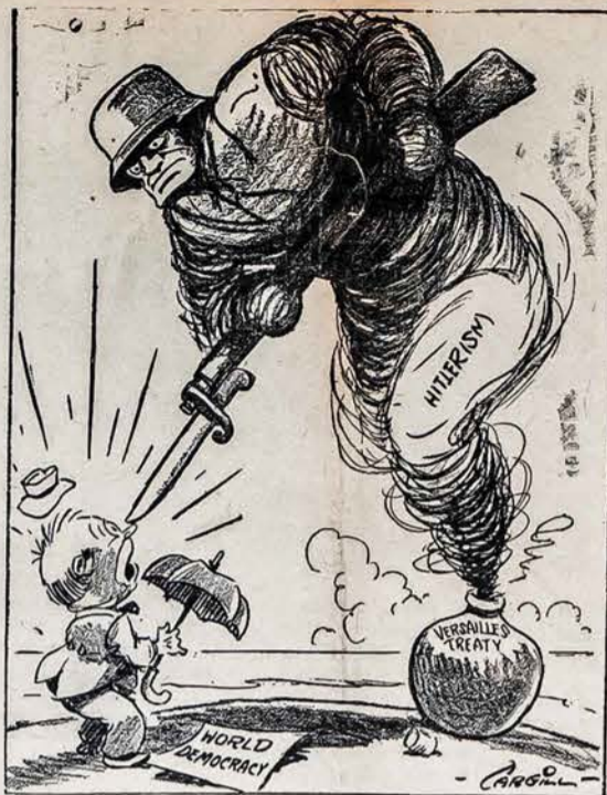
Raganiaus Dvasia šviesiai Bruuose Marškiniuose

Belgradas, Jugoslavijoje. — Nacių pareikalavo grekų baigti karą su Italija. To nepadarė, nacių kanda pradėti karą prieš juos. — Jau aną oriativai fotografuoja grekų karinę padėtį, o jų trukiniai su karveivais dund per Jugoslaviją į Bulgariją, iš kur sprendžiama, kad vokiečiai netrukus pradės ofensyvą prieš grekus, kad pagiebtai savo partneriai musulmanai.