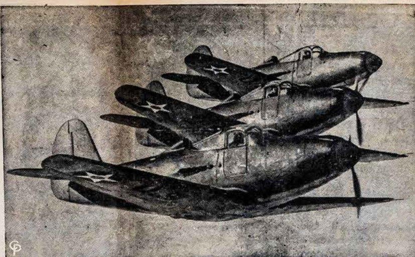
OROKOBRAIS PRISIPILDO ORAS