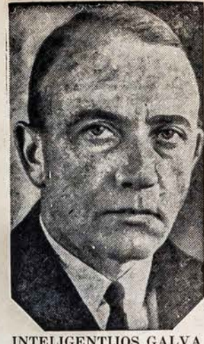
INTELIĞENTIOS GALVA Kap. Alan G. Kirk, ką-tik grįžęs iš savo laivyno pasiuntinybės pareigų Londone, dabar tapo nusikurtas laivyno inteligentijos direktorium. Jis yra patyręs karievis Tolimųjų Rytų tarnyboje, ir taipgi Europos tarnyboje. Jis tarnavo 18-ką mėnesių kaip vyriausiasis laivyno štabo tėmytojas Londone ir su britų laivynu.

Šis momentas labai svarbus ir privalome jį išnaudoti. Mūsų pareiga aktyvai sekti karo politiką didžiųjų tautų ir kiekvieną palankią progą mūsų tautos laisvės naudai kaip reikia išnaudoti karo metu idant tinkamiaus pasirengtume savo teises ginti taikos sulaukė. Dabar šiaurės Amerikos ir Pietų Amerikos lietuvių pareiga budėti, mūsų vadų pareiga rūpintis Lietuvos likimu, jos ateitimi. Tad nesėdėkim ranka už pečių susidėję, nelaukim idant kas atneštų mūsų tautai politišką nepriklausomybę ant sidabrinės lėkštės. Dabar laikas mums pasirodavoti, veikti, praktiškai pasirengti prieš rimos kovos už mūsų tautos laisvę ir nepriklausomybę. Dabar mums laikas užmegsti ryšius ir su mūsų oponentais, lenkais, susitarti su jais, kad po karo tarpe jų ir mūsų nepasikartotų praeities klaidos ir nesutikimai. Mes ir lenkai pasimokinkime iš praeities mūsų vadų klaidų ir pasimokinę turime rasti pagrindą mūsų santykių glaudumui.