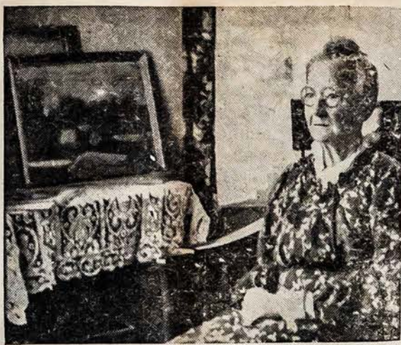
ASTUONIASDEŠIMTS METŲ UKININKO NASLĖ, ŽYMI ARTISTĖ

1832 m. Egipto karė prieš Turkiją tęsėsi per devynis m.