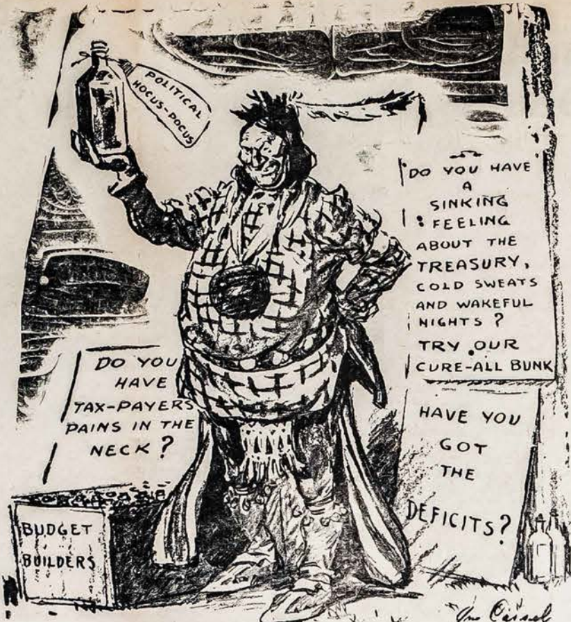
AR PASISEKS TAM DIDELIAM INDIJONŲ GYDYTOJUI ISGYDYTI SIAS LIGAS?