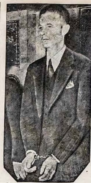
SURAKYTAS DEL PASIKĖSINIMO ANT PREZ. RUZVELTO

Protestonų kunigo pati buvo užmušta, kuomet vokiečių bombe... rių bomba pataikė tiesiog į baž... nyčią, ir anglo vikaro žmona bu... vo vietoj užmušta. Kunigas pa... siėmęs iš altoriaus kieliką ir ki... tus daiktus, šalma pridengtus, nešinas juos kur nors į prieglau... dą pasidėti.