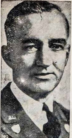
MILITARISKOS AKADEMIJOS GALVA