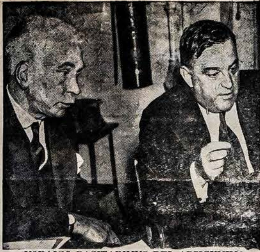
UŽBAIGĖ PASITARIMUS DEL APSIGYVIMO

Brangūs Radio Klausytojai! "Lietuvių Tautos Fondas" jau pasiuntė 200 dolerių į Berlyną Lietuvos Piličių Sąjungai, kad ji tais pinigais sušelpų lietuvių pabėgusius iš per bolševikus pavergtos Lietuvos. Tie du šimtai dolerių sudaro 1132