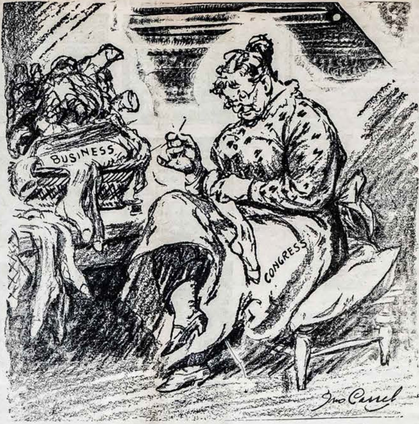
S. V. KONGRESAS RENGIASI PRIE NAUJO 1941 M. BIZNIO