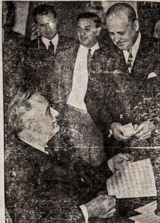
PERKA PIRMAS APSIGYNYMO MARKUTES Presidentas Roosevelt perka iš Gen. Pašto Viršinko Frank C. Walker, Baltajame Name pirmasias markutes iš nacionalio apsigynimo laidos. Markutės yra vieno, dviejų ir trijų centų rusių.