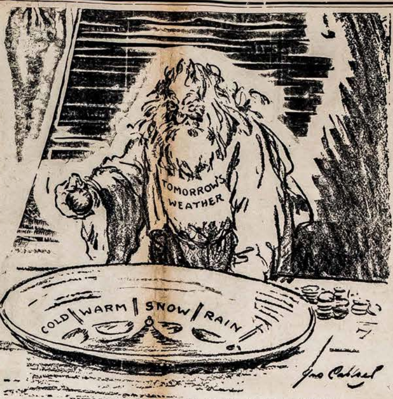
RYTOJAUS ORAS: ŠALTA, ŠILTA, SNIGEAŠ, LIETUS

Vaikas gimęs užsienyje po gegužės 24 d., 1934 m., tėvams, vienas iš kurių yra Amerikos pilietis, tampa piliečiu gimimu, tik jeigu jis prisilaiko prie nekurių parupinimų. Pirma, pilietis, tėvas prieš vaiko gimimą, turėjo gyventi dešimt metų Jung. Valstijose ar vienoje jos valdomų vietų, ir per penkis metus iš tų dešimt metų, po jo šešiolikto metų. Antra, vaikas pasilaiko jo stovį, kaip pilietis, tik jeigu jis gyvena Jung. Valstijose ar vienoje jos valdomų