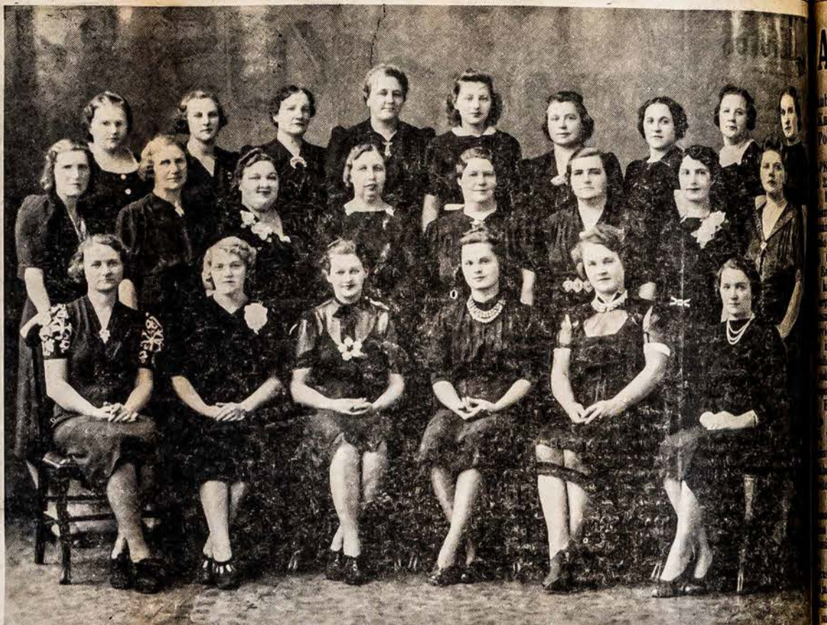
Worcesterio Lietuvių Moterų Klubo Choras

Toronto, Ont. — Kanados Lietuvių Taryba šaukia masinį mitingą lapkričio 23 d. (šeštadienio vakare), kuris įvyks parapijos salėje, kampas Gorevale ir Dundas gatvių, 8 val. vakare. Visi nariai įstojusių į Tarybą draugijų ir kurie aukavo po $1. ir daugiau, kviečiami dalyvauti. Mitinge kalbės vietiniai kalbėtojai, bus išduodami raportai iš Tarybos veiklos ir po to seks laisvos diskusijos. P. Kundrotas, K.L.T. Vice Sekr.