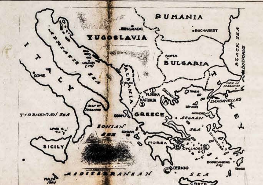
GREKIŲ TAPO KARO CENTRO Šis žemėlapis rodo naują karą tarp Britų laivynas susirinko Salonikoje. A. pagelbėti Grekių išvaduoti iš Italijos. Florina (1) ir Kastoria (2) buvo sušaudyti italų kareivių kurie maršavo iš Albanijos, gi Piraeus (B), Atėnų miesto prieplauka nukentėjo nuo užpuolimo iš oro. Grekijos ir Italijos laivynai kariauja, kol Italija bando paimti Crete (D) salą. Karo praplėtimui įsteigta Britų laivynui bazės Cerigo (C) ir Cyclades salose (E).