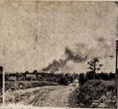
Didžiausias gaisras Lietuvoje: Liepos 7 d. vakare kilęs gaisras sunaikino didžiąją Jurbarko miesto dalį. Sudegė 168 namai miesto centre. Nuostolių padaryta už kelis milijonus litų.