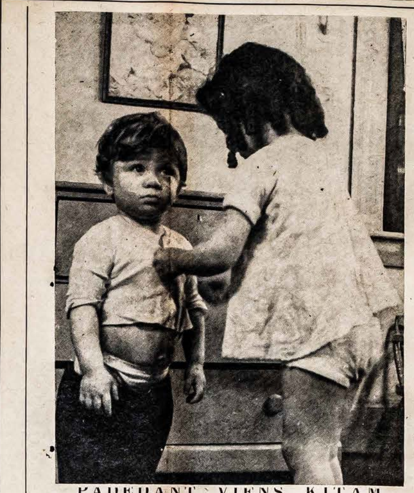
PADEDANT VIENS KITAM TOKI JAUNI — šie Dieninės Prieglaudos vaikai išmoksta kaip pagelbėti viens kitam.

Tiems, kurie nori likti Suv. Valstijų Piliėčiais, kad susipažinti su šalies Taisyklėmis ir Pareigomis. Knygelė Parašyta ANGLŲ IR LIETUVIŲ KALBOMIS