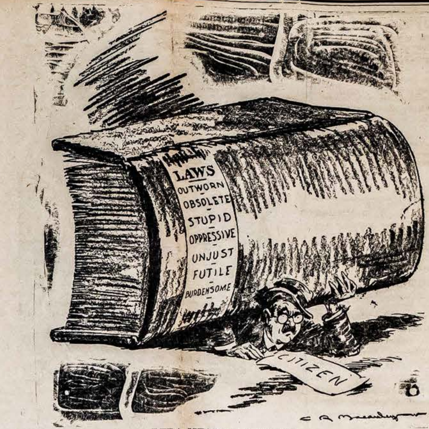
DEDA ĮSTATYMUS ANT JO

Pasaulyje yra buvę laikai, ka- da karai budavo tik kardu arba paprastų šautuvų, vėliau buvo išstobulinta kanuolės ir t.t. Bet pastaraisiais metais pasaulio technika, kuri žymiai pralenkė civilizaciją, sudarė moderniškus karo pabuklus, tokius, su ku- riais gali išžudyti pulkus ka- reivių akimirksnyje. Aišku, kad tokia mašinerija reikalauja gerai išlavintų karo technikų — ekspertų, kad galėtų tinkamai operuoti. Dėka šitokių sąlygų, ir susi- darė didelis trukamas mechani-