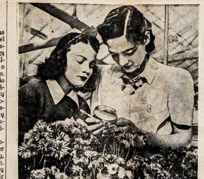
PILNAS KRIZANTIMŲ PAVYZDIS Čikagos Universiteto botanistės per 5 metų studijavimą išvystė krizantimų derlingumą, kurios dviem mėnesiais pirmiau pražydi ir išsilaiko prie 35 žemiau zero laipsnių temperatūros.

Iš tų mažųjų pradžių, Amerikos spauda išsivystė. Spaudos biznis šiandien vienas iš Amerikos didžiulių industrijų. Net suvirš 25,000 įstaigų samdo suvirš 400,000 darbininkų.