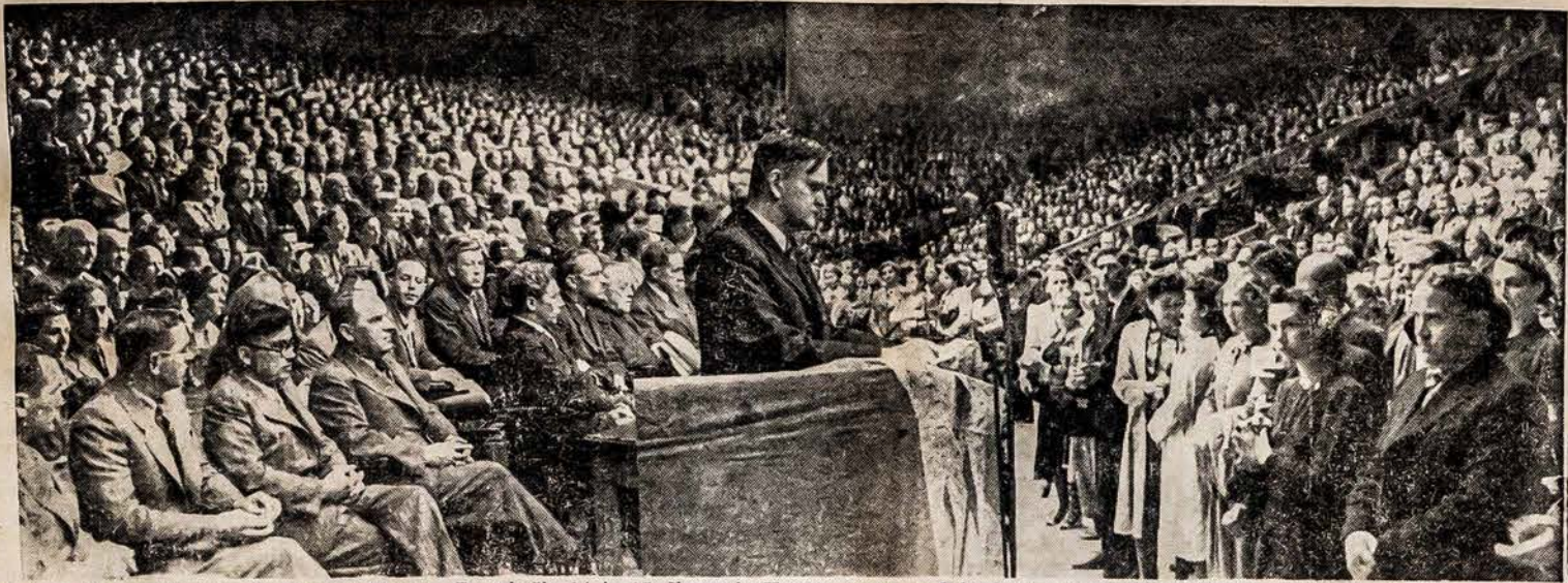
Didysis Lietuvos švietėjų kongresas Kaune. Rugpjūčio 14 ir 15 dienomis Kaune, Sporto salėje, įvyko pirmasis visuotinis Lietuvos švietėjų — visų mokyklų mokytojų, prieglaudų, vaikų darželių vedėjų bei mokytojų kongresas.