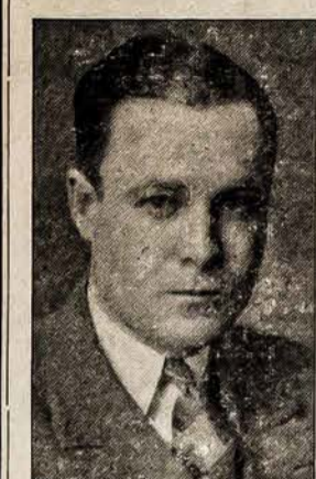
Išrinkite J. HOWARD McGRATH R. I. Valstijos Gubernatorium

Man labai malonu atsikreipti į Jus, kaip mūsų išdidžios mažos valstijos atstovaujantis pilietis. Ateinantį antradienį, šios valstijos piliečių pareiga bus padaryt svarbų nusprendimą, kurs pasieks labai toli.