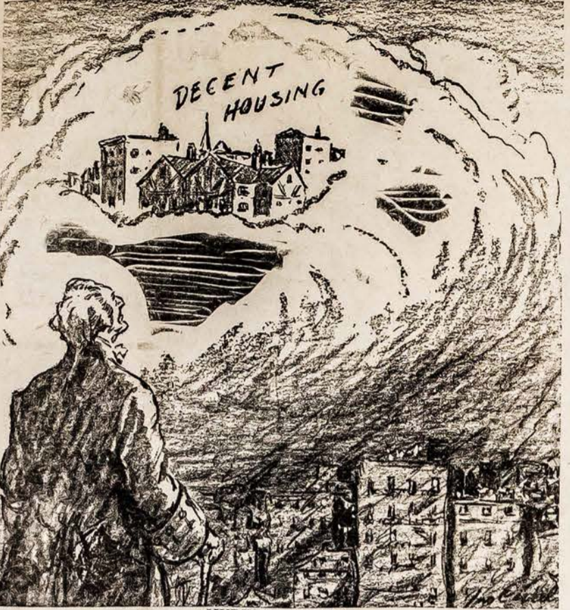
ZIURINT Į ATEITĮ

Istikrųjų Hitleris nenori, kad Francija kariautų prieš Anglija, nes tokis žygis Vokietijai yra labai pavojingas. Jeigu Francija kariautų prieš Anglija, tai ji turėtų savo kariuomenę, ginklus, laivyną ir kas galėtų užtikrinti, kad viena gražia diena Francijos kariuomenė neiškirstų labai ne-