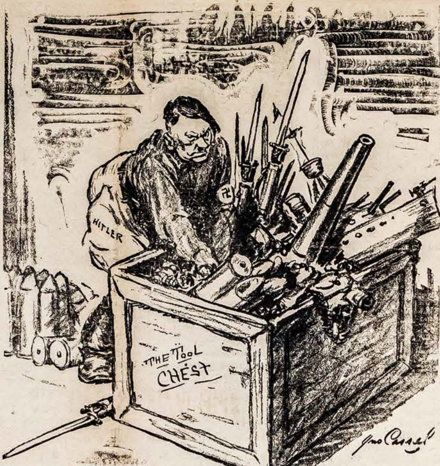
"MES NENORIME VEIKSMŲ IR VENGIAME NESUSIPRATIMŲ"

Kitas dalykas, tokia parama Prezidentui A. Smetonai vargiai būtų reikalinga; mat, Amerikos valdžia pripažysta tik senąją nepriklausomos Lietuvos vyriausybę ir kadangi Lietuvos vyriausybė čia Amerikoje turi didelius aukso deponiztus, kuriuos Prezidentas Rooseveltas "užšaldė" ir tas "užšaldymas" rodo