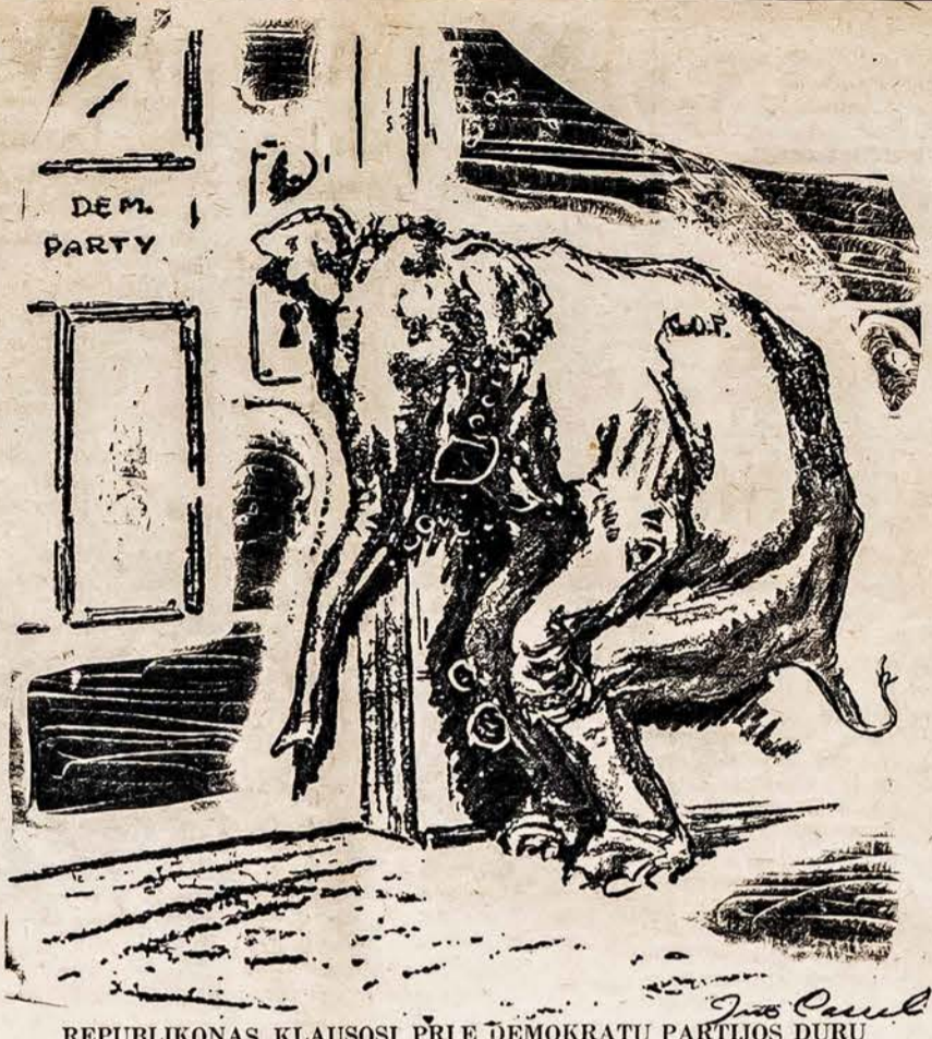
REPUBLIKONAS KLAUSOSI PRIE DEMOKRATŲ PARTIJOS DURŲ

AMERIKOS LIETUVIS 14 VERNON ST. — WORCESTER, MASS.