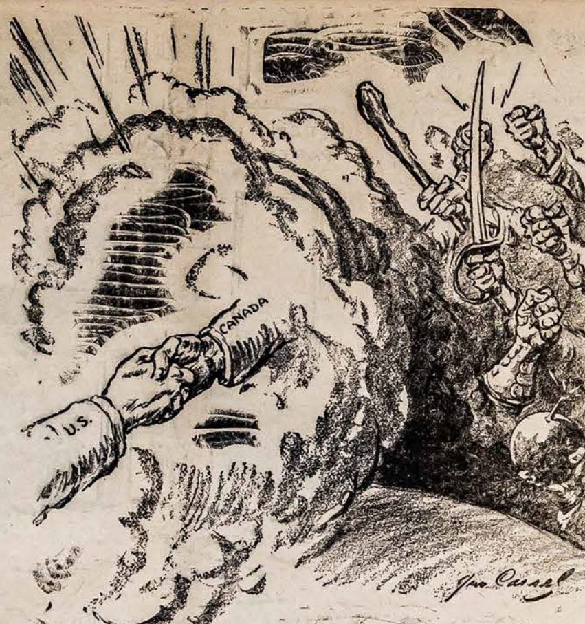
RANKOS, KURIOS SVEIKINASI, BET KUMŠTIS KOVĄ LAIMI

Todel kooperatyviai dirbant galima daug gero padaryti su