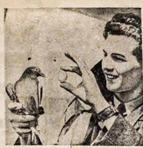
TIKRA KARO PAUKŠTUKĖ

AMERIKOS LIETUVIO SPAUSTUVĖJE ATLIEKA VISOKIOS SPAUDOS DARBUS