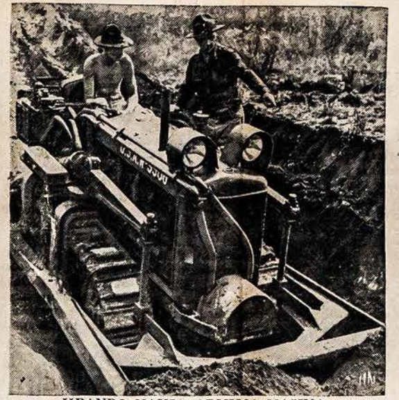
ISBANDO NAUJĄ ARMIJOS MAŠINĄ J. V. Armijos nauja apkasų kasimo mašina yra didelė pagelba amerikonom kareiviams. Šita mašina parodė ką ji gali laike Antrosios Armijos manevrų McCoy stovykloj, Wisconsin valstijoje.