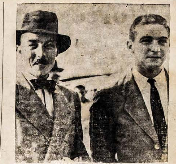
NORI BUTI KARALIAIS Iš britų spaudos sužinota, kad maršalas Henri Petain, Prancuzijos fašistų valdžios galva, pasiuntė agentą į Braziliją pasitarti su Comte de Paris (kairėje) apie Prancuzijos monarkijos atsteigimą. Sykiu su Prancuzijos sosto pretendentu, stovi Dom Joao de Braganca, Brazilijos sosto pretendentas. Paveikslas buvo nutrauktas Petropoly, Brazilijoje.