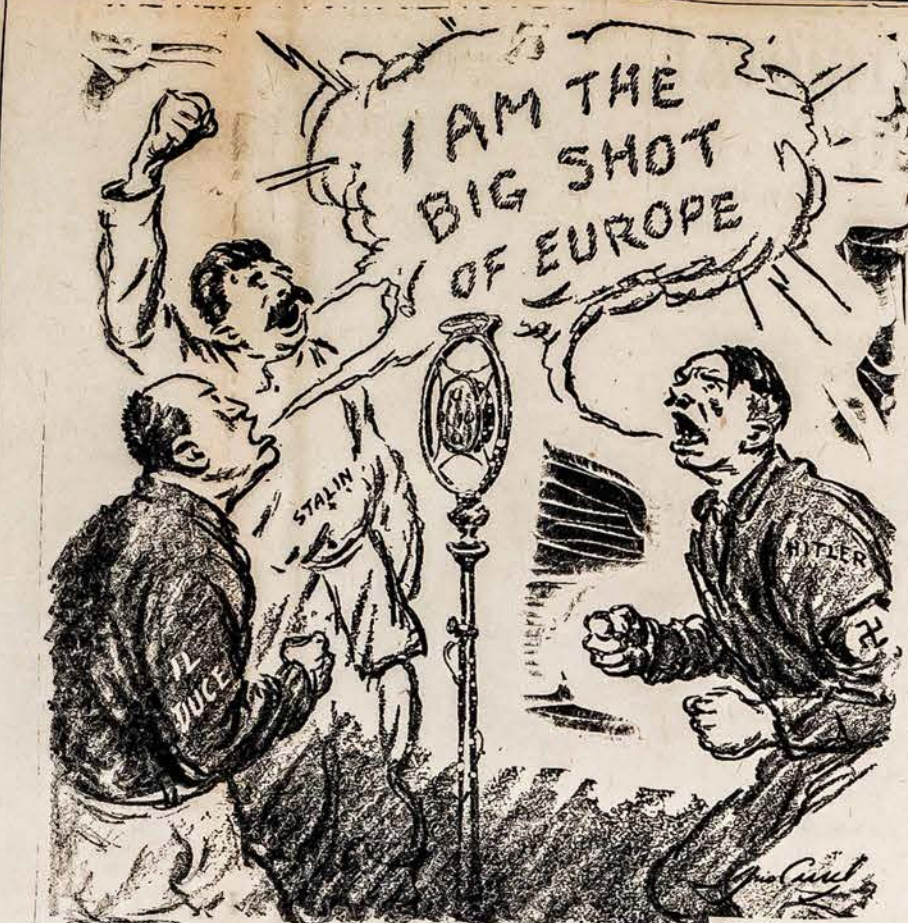
SEKANTIS KARAS BUS VEDAMAS ORE "Klausykite, jus", — per radiją šaukia Stalinas, — "aš esu Europos valdonu!" Gi Mussolini su Hitleriu pavydi jam.