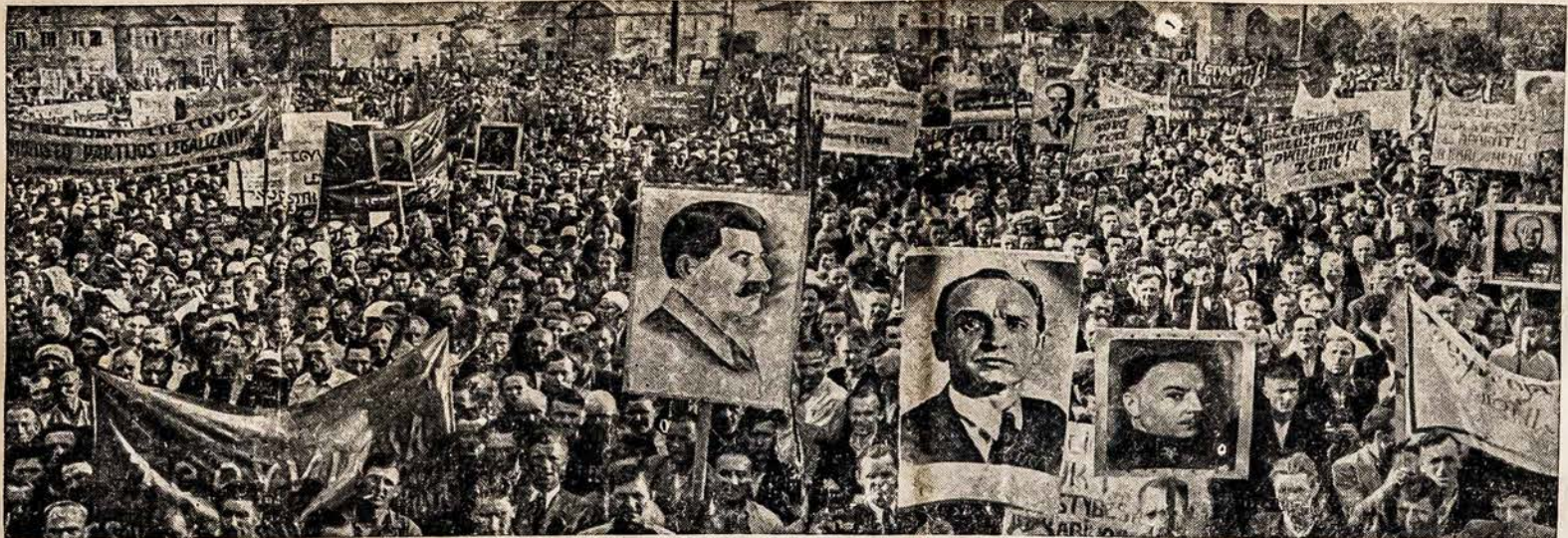
Pirmosios milijoninės darbo liaudies manifestacijos įvykusios Kaune, birželio 24-tą dieną, vaizdas. Vaizdo viduryje matomi Stalino, Justo Paleckio ir Vorosilovo atvaizdai. Toliau daugybė plakatų, vėliavų ir transparentų. Mitinge Petro Vileišio aikštėje dalyvavo 70.000 žmonių, o eisenoj prie Liaudies Vyriausybės rūmų ir Sovietų Sąjungos atstovybės dalyvių skaičius padidėjo, kaip sprendžiama, iki 100.000.