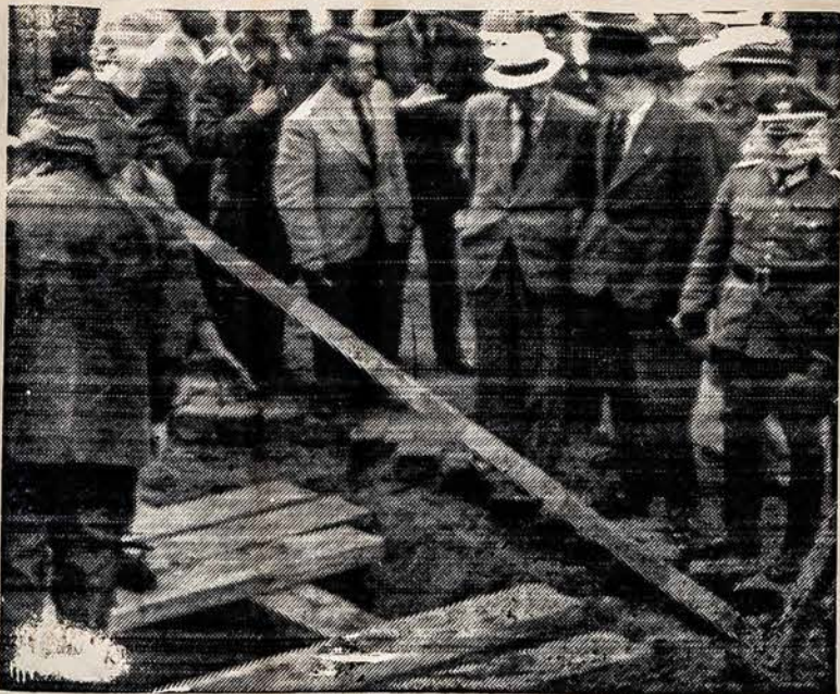
BRITŲ LEKTUVAS ISMETĖ BOMBĄ HAMBURGO GATVEJE. Smalsūs vokiečiai piliečiai Hamburge apžiūri skylę padarytos bombos laike britų užpuolimo iš oro ant Hamburgo. Nacių cenzorius nori šiuomi paveikslu įrodyti, kad britai nepadarė tiek daug žalos kaip skelbia. Fotografija buvo perduota per radio iš Berlyno į New Yorką.