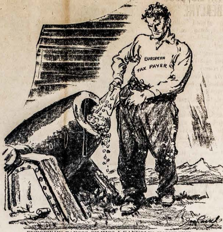
EUROPIEČIŲ TAKSOS PILIMOS Į KANUOLIŲ VAMZDZIUS

Pas lietuvius penktoji kolumna susidaro beveik išimtinai iš komunistų ir jie budami komunistais, kartu yra fašistais ir nacijs. Mat prie dabartinės tvarkos tos visos trys partijos kariauja išsivystę, taip kad Stalinas, Hitleris ir Mussolinis yra vienas kunas trijose asabose. Tad tie lietuviai, kurie pri-