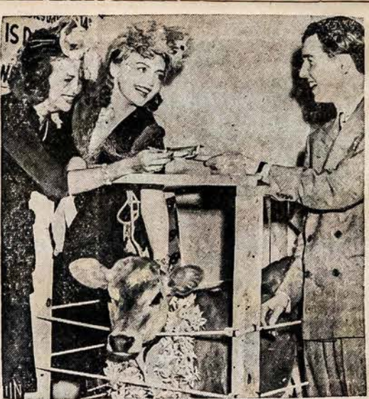
TIKIETAI PIENO FONDUI

Pirmiausia, reikia buti pa... tiems pažangos nešėjams griež... tiai pažangiems. Reikia išsiner... ti iš dusinančių aplinkybių ir... išeiti į šviesų žmonijos pažangos... kelių laisvam ir kupinam pasi... aukojimo! Čia dažnai labai kliu... do įsisenėję "papročiai" ir visi... tie, kaip sakoma, "visokio am... žiaus ir abiejų lyčių senos bo... bos", kurie bijo pažangos ir nuo... jos stabdo kitus. Taip labai daž... nai elgiasi tėvai su vaikais, o... vaikai — "kad patenkinti tė... vus", dažnai atsako nuo tikros... pažangos, (čia nereikia sum... maišyti tokių dalykų, kaip, pa... vyzdžiui, visos Amerikos spau... doje nušvitavęs dukrelės pa... veikslas su cigaretu dantyse, ... kai ji teismu privertė tėvą ne... drausti jai rukti, gerti ir nak... timis nebūti namie...). Jeigu vi... si butų "dėl tėvų" laikęsi visų... senų maldų ir "papročių" tai... šiandien mes turėtume raudonu... moliu nusivėlę pilvą šokinėti... apie ugnį arba nesiprausti —... tik tam, kad patenkinti įvai... rios dievus, nuo kurių musų tė... vai negalėjo skirtis... Ne, pa... žangos, kultūros, kelyje tokie, ... kad ir tėvų, kliudymai neturi... prasmės! Toliau, — asmenų gy... venime labai dažnai ima kliudy... ti "šeima". Pavyzdžiui, vienas