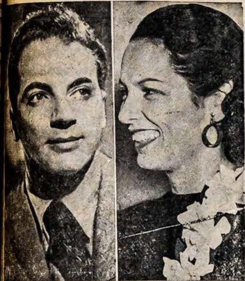
ITARIAMI UŽ KOMUNIZMĄ

niacių ar fašistų... ir kad jos dabar... ia. Registracija yra... ilas, bet ne prie... kurie bus sugauti... acijos ir nepilietiš... žiami ir gal but... i ten, iš kur jie at... struotis reikia vis... ieciams ir nežin... ie turėtų pirmas p... ant antrų aplika... padavę. Tie, kur... antrų popierių, k... istai sakoma, tie... ikos piliečiai ir j... o 15 metų amžiaus... ruotis.