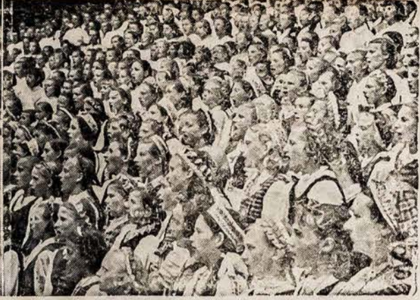
Kauno miesto mokyklų šventės dalyviai