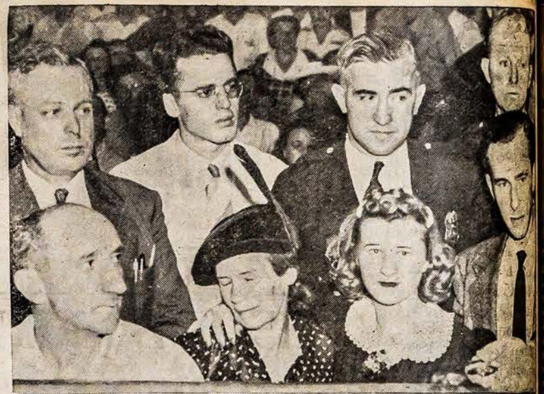
SAKO, NE JOS VYRAS