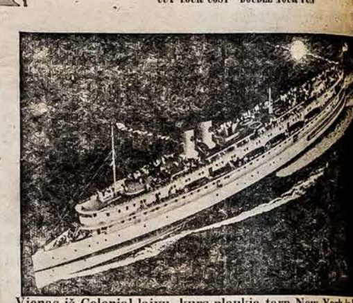
Vienas iš Colonial laivų, kurs plaukia tarp New York ir Providence