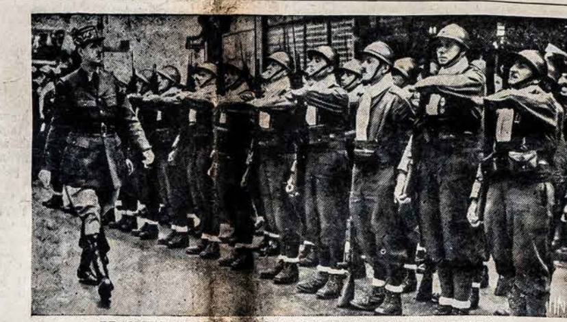
PRANCUZŲ KARIUOMENĖ GATAVA KAUTIS UŽ ANGLIJĄ Prancuzų armijos Generolas Charles De Gaulle, peržiūri savo kariuomenes Londone. Neatsižvelgiant į Anglų-Prancuzų vaidus ir į netekimą Prancuzijos kaip talkininkės, prancuzų svetur esanti kariuomenė yra pasiryžusi kariauti už Angliją dėl savo šalies laisvės.