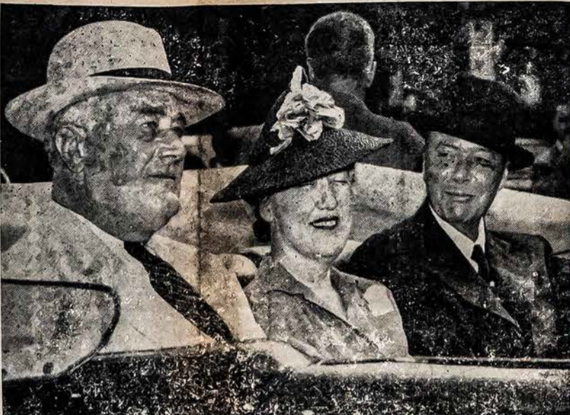
WM. BULLITT, PREZIDENTAS RUZVELTAS IR SEKRETORĖ MARGARET LE HAND