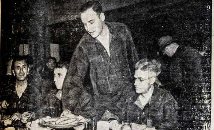
BIZNIERIAI MOKA PINIGUS UŽ KARISKO PRATIMO KURSĄ 700 biznierių atvyks į Plattsburgą, N. Y. kempę, kur jie turės 30 dienų militariško pratimo pamokas, už kurias užsimokės $46.50.