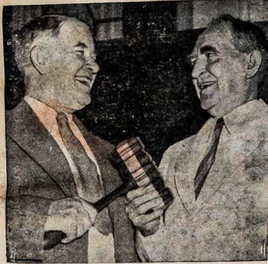
DEMOKRATŲ SEIMO PLAKTUKAS

William B. Bankhead, Buto Kalbėtojas, kurs nustatys obalsį Demokratų Tautiniam Seimui, Chicagoj. Jisai rodo plaktuką, kurs buvo naudojamas jau paskutiniuose demokratų seimuose del senato didžiūmos vado Alben W. Barkley, seimo nuolatiniam pirmininkui.