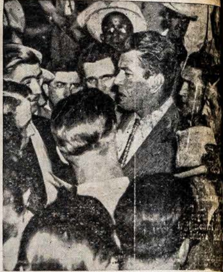
TUNNEY IR JOJO SANDRAUGŲ FRONTAS

Vienas žmogus rusinas, bandė pasipiauti su britva. Išgulėjęs ligoninėje dvi savaites, jau pasveiko, bet darbo negauna ir nėra vilties kad gaus. Tai ką padaro girtuoklystė. Yra taipgi čia įvairių bausių atsitikimų laiko nuo laiko. K. S.