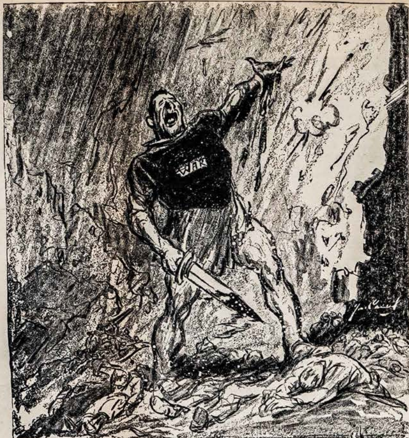
JAU KITŲ KARO PALIAUBŲ EUROPOJE IESKO?

Tai kodėl lietuviški bolševikai, kurie tankiai dar sakosi giną Lietuvos reikalus, nemato didelių diktatorių, kurių armijos išplovė jau šimtais tukstančių žmonių, o tik mato Antano Smetonos diktaturą, kuri buvo didesnių diktaturų įrankis ir kuriai teko nuo jų didelius smugius panešti, net netekti savo brangaus uosto, Klaipėdos; sositinės Vilniaus ir vieno trečdalis Lietuvos teritorijos dabar rusų okupuotos.