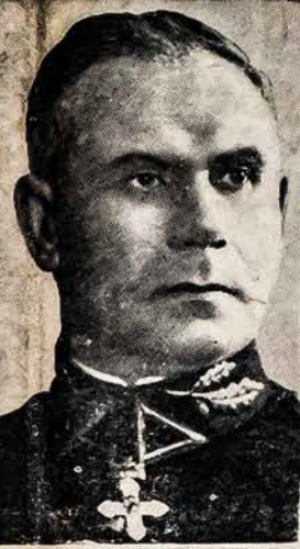
DIV. GEN. VITKAUSKAS, KARIUOMENĖS VADAS

San Sebastian, Ispanijoje, liepos 4. — Prancuzų karo nuostoliai žmonėmis, sulig vokiečių apskaitliavimo buvę 1,500,000 užmuštų, sužeistų ir dingusių, o daugiausiai, tai buta užmuštų. Prancuzai patys prisipažysta prie tragiško su vokiečiais karo pralaimėjimo. Jiems truko žmonių, ginklų, tankų, orlaivių ir ant galo pastangų, kad karą laimėtų priešais vokiečius, kurių gyventojų skaitlius siekia 80,000,000, o prancuzų tik 40,000,000.