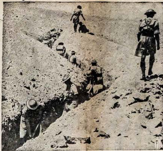
BRITŲ APKASAI NETOLIMŲ RYTŲ KARUI Britai, kurie kasa ilgą apkasą Egipto dykumoje, del apsi- gynimo. Egipto armija nors maža, bet gerai apginkluota. Vien- nok, didelis alijantų karių skaičius Netolimuose Rytuose Egipt- to kariuomenėje yra sustiprintas.

Aišku, kad Europoje bado šmėkla neišvengtina, todėl butų gerai, kad Amerikos lietuviai pasirūpintų Lietuvos žmonių pa- šelpa, ir tas reikalas yra buti-