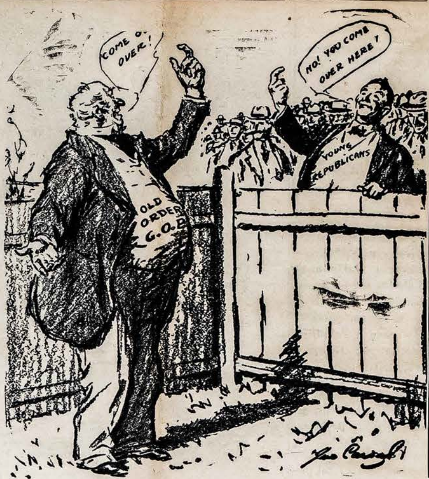
VIENAS KITĄ VADINASI