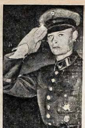
UZMUSTAS KAUTYNĖSE Pirmasis leitenantas, karalaitis Vilhelmas (viršuj), buvusio Vokietijos sosto įpėdinio vyriausias sunus ir eks-Kaizerio anukas — numirė po operacijos del sužeidimo kautynėse netoli Ghent. Jis buvo pirmose eilėse nuo to laiko kada vokiečiai užpuolė ant Belgijos ir Danijos.