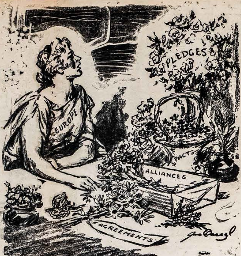
EUROPOS TAIKA PIRM KARO BUVO VAINIKUOJAMA VISOKIOMIS SUTARTIMIS IR GĖLEMIS. O ŠIANDIEN KUR JI?

Šie ir kiti Amerikos lietuvių gyvenime paliesti klausimai turėtų būti Lietuvos Pasiuntinybės išaiškinti be atidėjimo. Mums, amerikiečiams, yra labai svarbu žinoti kaip mes turime žiūrėti į dabartinę mūsų buvusios tėvynės Lietuvos santvarką, ar mes į ją turime žiūrėti kaip į Laisvą Lietuvos Respubliką ar kaip į rusais pavergtą kraštą?