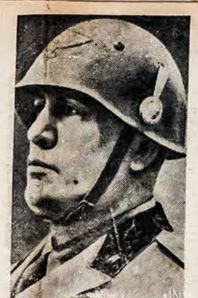
ITALIJOS DIKTATORIAUS NAUJA KEPURĖ Čia premiero Benito Mussolini vėliausias paveikslas, rodomas Italijos diktatoriaus naują karinę salmą. Visi ženklai rodo, kad Italijos diktatorius atsisąžės savo neutraliteto ir stos į karą Vokietijos pusėje.