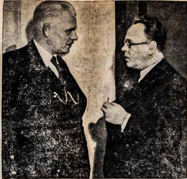
Ministras Pirmininkas A. Merkys kalbasi su Sovietų Sąjungos įgaliotu ministru Lietuvai N. Pozdniakovu "Eltos" 20 metų sukakties minėjime 1940 m. kovo 31 d.