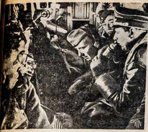
VEZAMI KARO LAUKAN