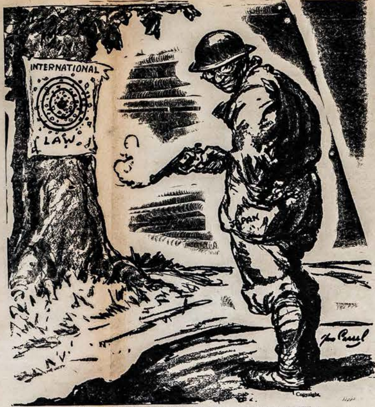
TARPTAUTINĖS TAISYKLĖS REVOLVERIO VAMZDY

Kita bėda su Mussoliniu yra ta, kad jis nori surasti kas laimės šį karą? Kaip dabar atrodo, talkininkai labai nepasekmingai kariauja, tačiau jeigu DĖDĖ SAMAS jiems duotų amunicijos, lėktuvų, tai su laiku Vokietijos galybė sunyktų. Dabar kada jau Mussolini norėjo gelbėti Hitleriui, tai Prezidentas Rooseveltas ir Kongresas paskyrė dideles sumas pinigų karo reikalams. Tas Amerikos žygis Mussoliniui sumaišė pėdas, nes jei Amerika