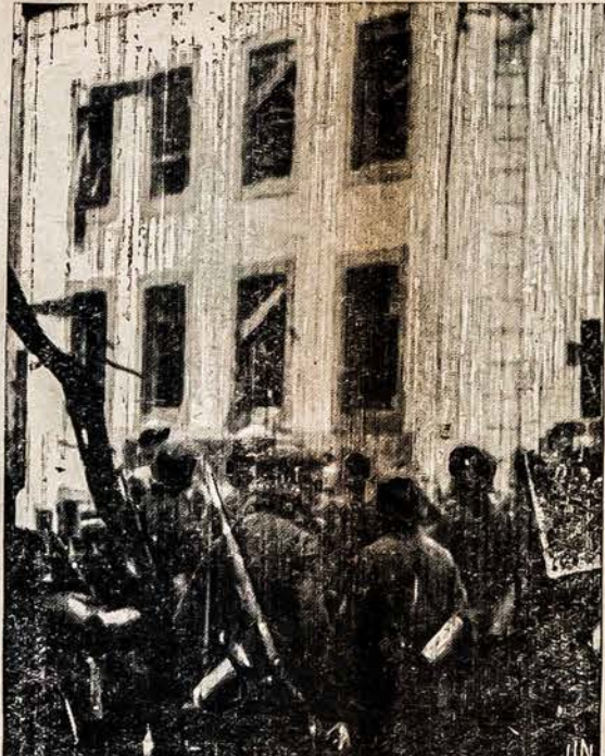
NACIAI TĒMIJA BELGIJOS MURŲ GRIUVESIUS. Sulig Vokietijos cenzūros perleistas nuotraukos, matome, kaip naciai tēmija Belgijos išdinamituos murus, kuriuos belgai besitraukdami išdinamitavo; jie išdinamitavo netik murus, bet bēgius tiltus ir kelius, kad tuomi sulaukyti nacių pirmynžangą.