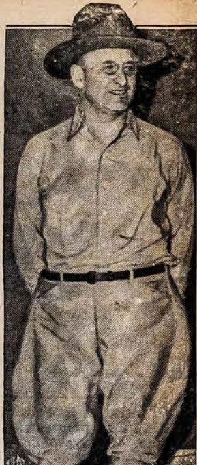
Bandininkas Finansistas HENRY MORGENTHAU