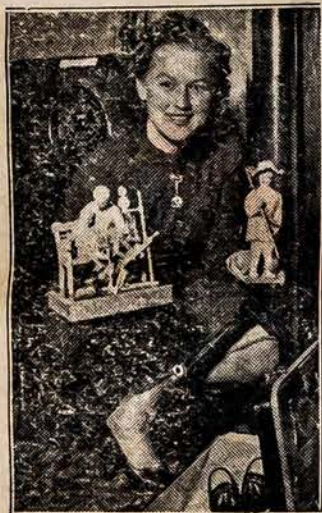
SUGRYŽO IŠBUVUSI EUROPOJE PENKIS METUS