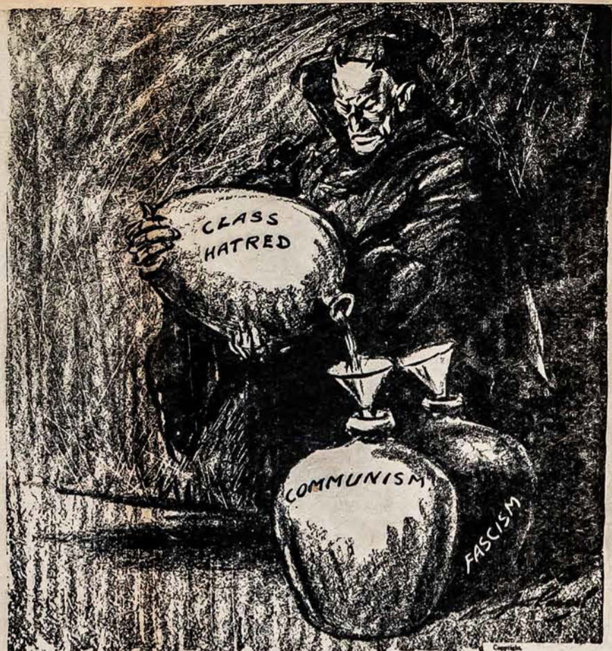
KLASŲ NEAPYKANTA PILAMA Į KOMUNIZMO IR FAŠIZMO INDUS

Suprantama, vokiečiai užima geresnę strategos atžvilgiu poziciją negu jų oponentai, nes vokiečiai randasi centre Europos žemyno. Vokiečių karinės jėgos — kariuomenė ir karo laivynas nepadalintas į dalis, neišmėtytas kaip anglų ir francūzų po platų pasaulį, todėl vokiečiams prie tokių sąlygų lengviau kairauti negu jų oponentams, kurių kariuomenės ir ka-