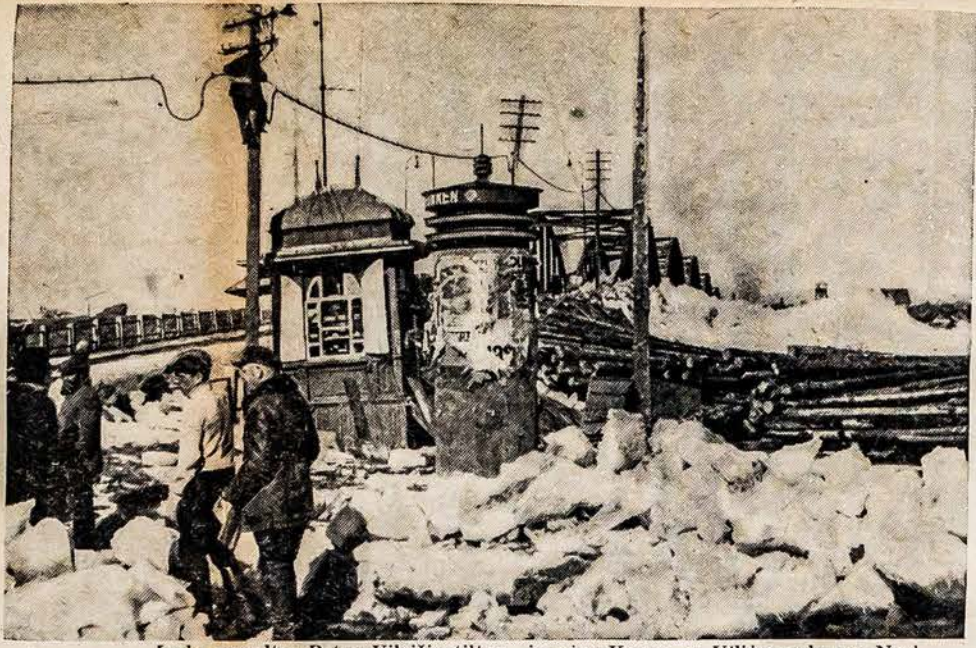
Ledų apgultas Petro Vileišio tiltas, jungiąs Kauną su Vilijampole per Nerį.

vonių. Nuo to laiko čia sveikatos ieškančių nestinga. Per trumpą laiką gydykloje įvyko stebėtinų pasveikimų, kur ne vienas, vos šiaip taip lazdomis pasiremdamas reumatikas beįstengęs paeiti, iš čia grįžo visiškai sveikas. Dabar gydykla ir be reklamos pradeda darytis garsi visoje Lietuvoje. Gydytinio vandens analizės parodė, kad jo gydymoji galia yra lygi garsiausiems užsienių vandeniems, o kai kuriuos ir pralenkia. Abu Smardonės šaltiniai per 24 valandas duoda per 20 milijonų litrų vandens, iš kurio būtų galima paruošti 75,000 vonių. Atsiradus kapitalo, iš Likėnų išietų labai svarbi reumatikams gydymosi vieta, kuri patrauktų net iki Lietuvos, bet ir užsienių ligonius.