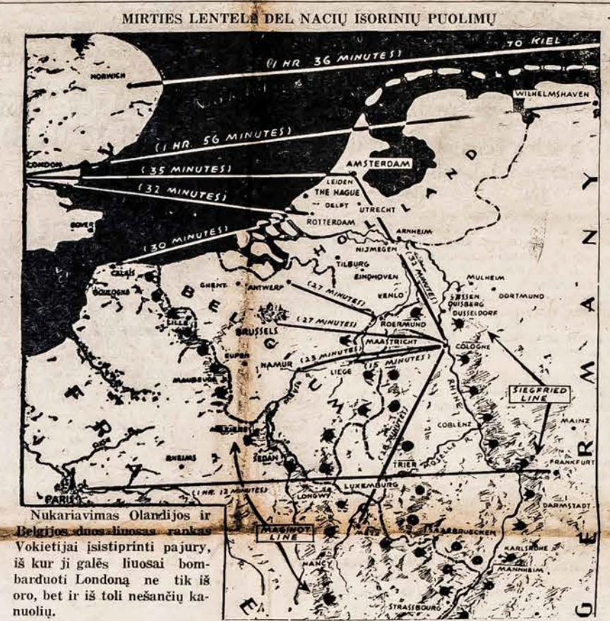
MIRTIES LENTELE DEL NACIŲ ISORINIŲ PUOLIMŲ

Mes nenorėtumem būti raudonojo teroro pranašais, tačiau susidėjusios kariaujančių šalių aplinkybės prie