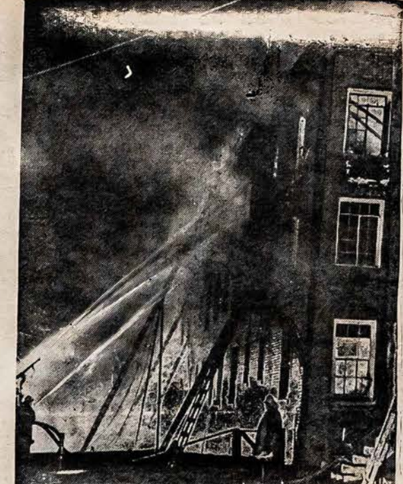
TRYS MIRĖ GAISRE Trys žmonės mirė ir daug buvo sužeisti, kada suliepsnojo namas netoli Baltųjų Namų Washingtone. Gaisrininkai ilgai ieškojo griuvėsiuose kitų aukų, nes iš 130 gyventojų daug gaisro metu nebuvo suskaičyti.

Klausimas: Kiek į mėnesį galima uždirbti prie National Youth Administration? Atsakyimas: National Youth Admin. duoda neturtingiems studentams darbus, kad jie galėtų ant toliaus tęsti savo mokyklos ar kolegijos darbus. Tie studentai tik paskirtą laiką dieną dirba. Aukštesnės mokyklos studentas gali užsidirbti $6. į mėnesį, kolegijos studentai nuo $15. iki $20 į mėnesį, ir baigę kolegijas studentai $30 į mėnesį. Pereitais metais net 435,000 jaunų studentų gavo pagelbos nuo National Youth Administration.