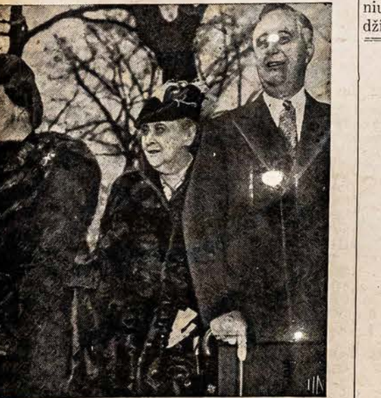
SVENČIA SEPTYNIŲ METŲ SUKAKTUVES... (text continues)