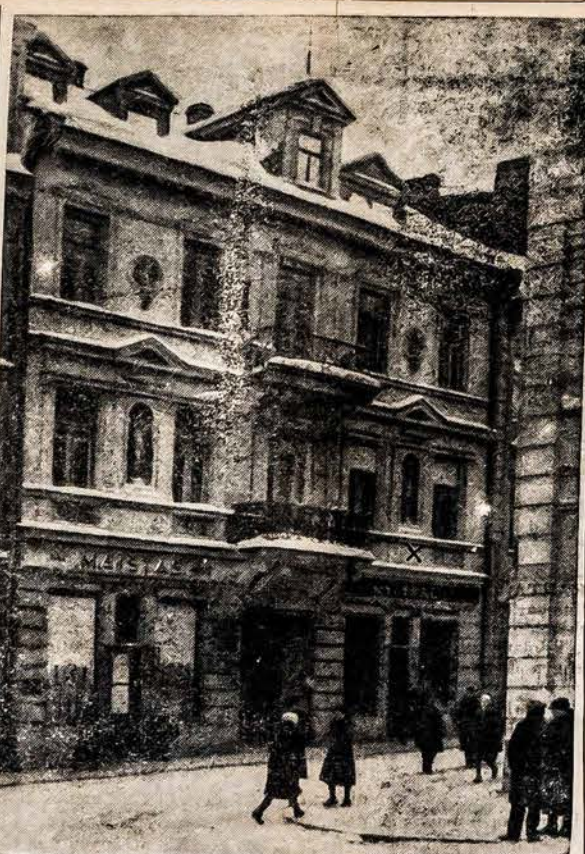
NAMAI, KURIOSE BUVO PASIRASYTAS LIETUVOS NEPRIKLAUSOMYBES AKTAS Tie namai randasi Didžioji gatvė Nr. 2., kur buvo Didžiojo karo metu nukentėjusiems nuo karo šelpiti komiteto patalpos. Prie to kambario, kuriame Nepriklausomybės aktas buvo pasirašytas, šio vasario 16 d. su iškilėmis buvo prisegta paminklinė lenta (antrajame aukšte, iš dešinės nuo balkono).