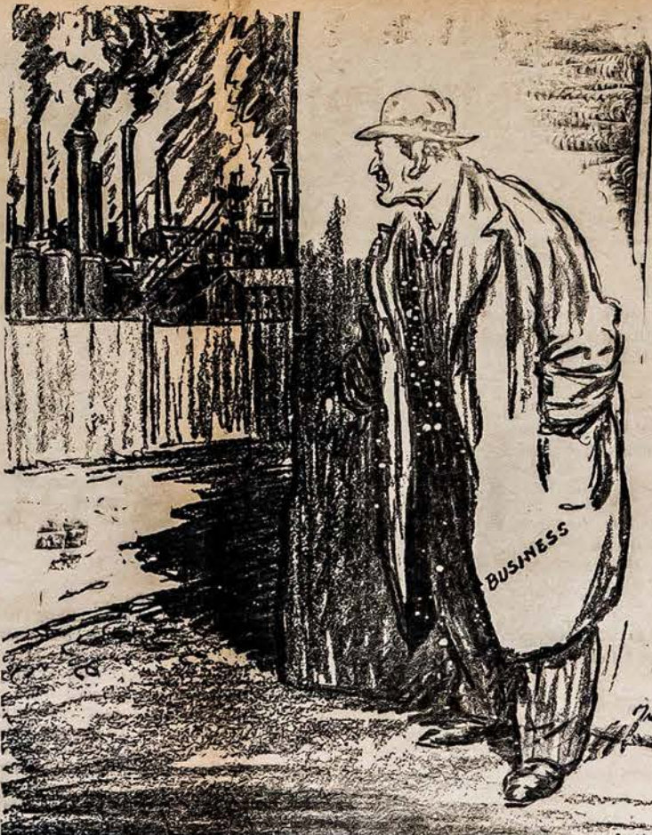
NUSPRESTA: — NELAUK PRAMONĖS ATSIGRIEBIMO, BET BE BAIMĖS GELBĖK JAI ATSIGRIEBTI

Kas gi pagaliau tie Vidurio žmonės yra, apie kuriuos kalba tulas p. Talkininkas minėtame straipsnyje? Rodos klaidos nepadarysiu pasakęs, kad tai yra toji visuomenės dalis kuri turi drąsos eiti savų lietuvišku keliu; del to tai šią srovę tiksliau vadinti tautinės visuomenės srove; kaipo tokia ji aiškiai skiriasi ir nuo dešinės ir nuo kairės,