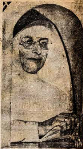
SESUO PASTO VEDĖJA

Ponas politikierius tuomsykd dirbo kitą darbą. Jis visiems kandidatams į viršininkus siuntinėjo "karštus" laiškus su paklausimais ar jie pritaria jo straipsniui tilpsumam Tėvynės No. 6, pridedant ir grumojimą: "Sulyg kandidatų pozicijos šiame klausime, nariai galės spresti kandidatų rinktinumą". Aiškiai sakant, tai buvo grumojimas: Jei pritari, tai busi išrinktas, o jei nepritari, tai... Kadangi atsakymo reikalauta