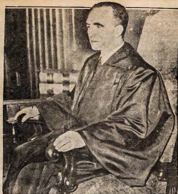
PASKIRTAS I AUKŠČIAUSI TEISMA

AMERIKOS LIETUVIO SPAUSTUVĖJE ATLIEKA VISOKIUS SPAUDOS DARBUS