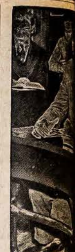
SYPSOJASI IS TI