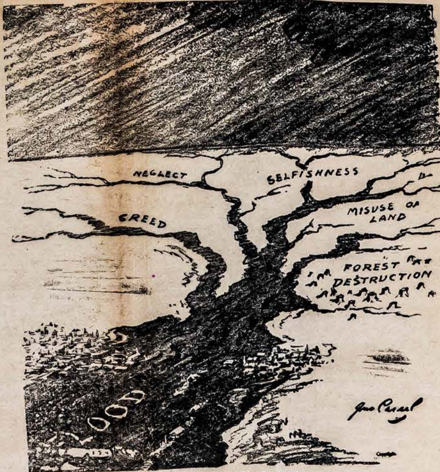
POTVINIAI — MOKESČIŲ NAŠTA

Aišku, kad karo nenori Anglijos ir Prancūzijos žmonės ir vyriausybės, bet kariauja sąlygų verčiamos. Karo nenori ir Hitleris, tačiau kariauja. Ligi šiol