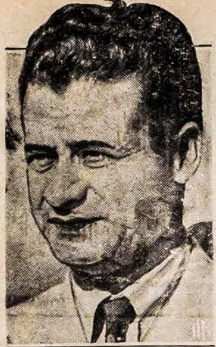
NAUJAUSIAS DIKTATORIUS Jose Felix Estigarriba Preidentas Generalas Jose Felix Estigarriba pasiūlymė save Paraguay valstybės diktatorium idant "išgelbėti respubliką nuo anarkijos". Jisai paskelbė, kad laivynas ir armija remia jo aktą.