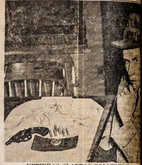
NETIKRAS SLAPTAS POLICININKAS

Mūsų geraširdės moterys pagamino daug skanesių šiai vakarienei. Dabar reikiama padėkos žodį rengėjoms už tokią jų trušą, už pavaišinimą tiek daug žmonių. Buvo nelengvas darbas sukviesti tiek daug žmonių. Yra labai geras darbas atliktas susėlimui sergancios moteries. Brangūs lietuviai, labai ačiū už gausų atsilankymą ir parėmimą ligonę moterį. F.J.V.