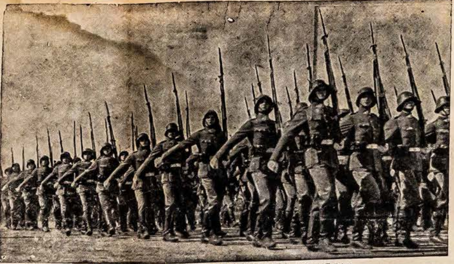
LIETUVOS NEPRIKLAUSOMYBĖS GYNĖJAI

Tas momentas buvo kritiškas. Kaip tik vokiečiai pradėjo apiešti Lietuvą, tuojaus pasirodė rusų, lenkų ir Gen. Goldfzo kariuomenės tykojančios ant Lietuvos nepriklausomybės. Dr.