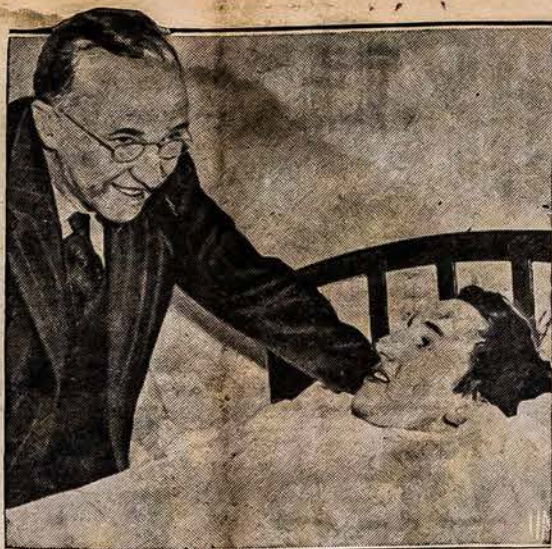
BUVO PAKLYDĖS VĖTROJE

tikrai žinoti kur eini ir į kokią mašiną—automobily sėdi. Vėlybose naktys reikia vengti kiek galima pasivažinėjimų. Tokia bausia nelaimė naktį patiko viršminėtas jaunuolis. Priėjo dis yra "neik su velniu oboliu-ti". Tikrenybėje, reikia apgailestauti tokius įvykius, kurių ir perdaug matome. Pilni anglų laikraščiai apie automobilio nelaimes, daugumas vis "naktiniai paukščiai". K. D.