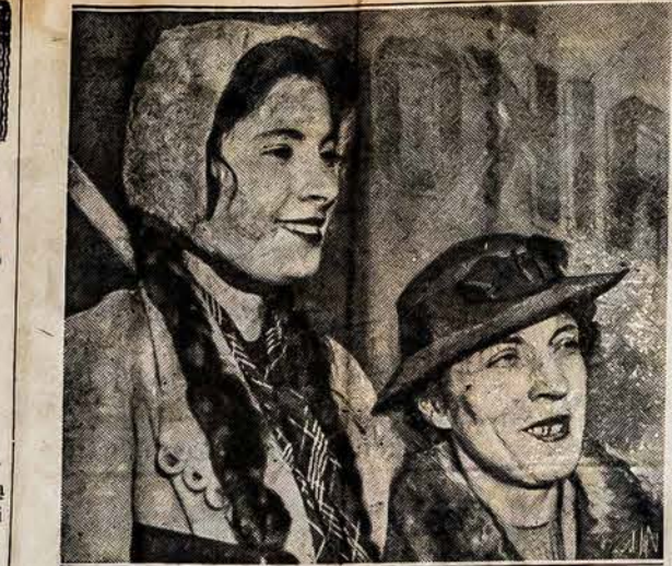
PABĖGO IŠ LENKIJOS