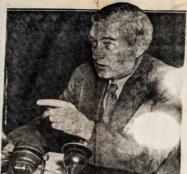
EDISON RAGINA SUSTIPRINT LAIVYNĄ

Areštuoti esą kaltinami už rengimąsi nuversti valdžią? Kodėl? — Washington? — Bet greičiausiai New Yorko laikas ir paties New Yorko miesto, kur tik beveik vieni žydai žodžiu sakant, tas "krikščionių frontas" yra ne kas kitas kaip antisemitizmo diegė, kurie dygsta anksti pavasario mėnesį. Bet kas bus kaip ateis vasara? Antisemitizmas beveik vi-