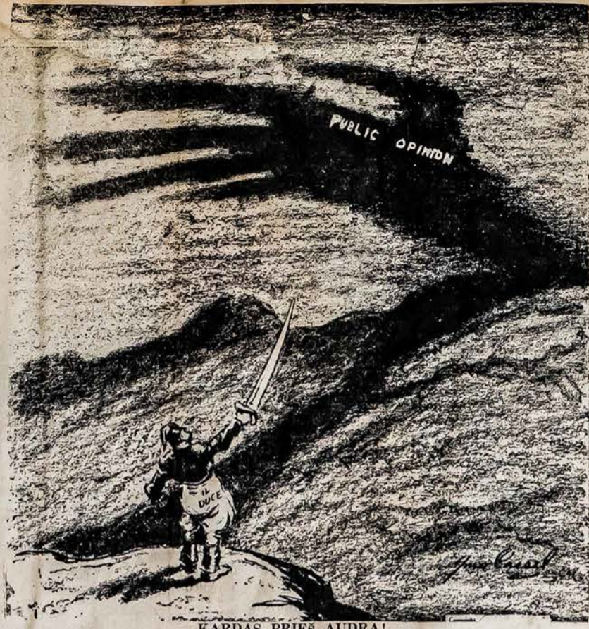
KARDAS PRIEŠ AUDRĄ!

Kas-gi davė mums naujos eros vadus: S. Daukanta, vyskupą Valančių, Dr. Basanavičių, Dr. Kudirką, Dr. Šliupą, Akelaitį, Čiurlionį, Vaičiaitį, Maironį, Vaišgantą ir kitus naujos gadynės didvyrius? Aišku, kad mūsų tautos praeitis. Štai kodėl aš sakau,