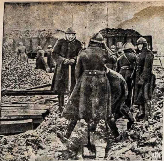
Belgijos kareiviai kasa apkasas šalia gelžkelio linijos, kuri eina netoli Vokietijos rubežiaus. Jos karių atostogos atidėtos ir ren- gamasi prie karinės valgių proporcijos bei maisto kortelių siste- mos, nes tikisi vokiečių įsiveržimo per jų rubežį.

Šita gramatika daugiausiai taikoma del čiagimusio jau- mo, kad galėtų tinkamai savo tėvų kalbą išmokti su anglų boje pateiktais paaškinimais. Todel patartina kiekvienam čia gimusiam jaunuoliui ir auoliui šią gramatiką įsigyti. Išigyti, busite patenkinti, greitai išmoksitė taisykliškai lietuviškai skaityti ir ra- sulig šioje gramatikoje pateiktų taisyklių.