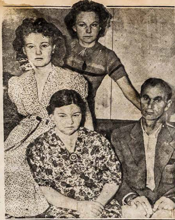
NUZUDYTOS MERGAITĖS TĖVAI IR SESERYS