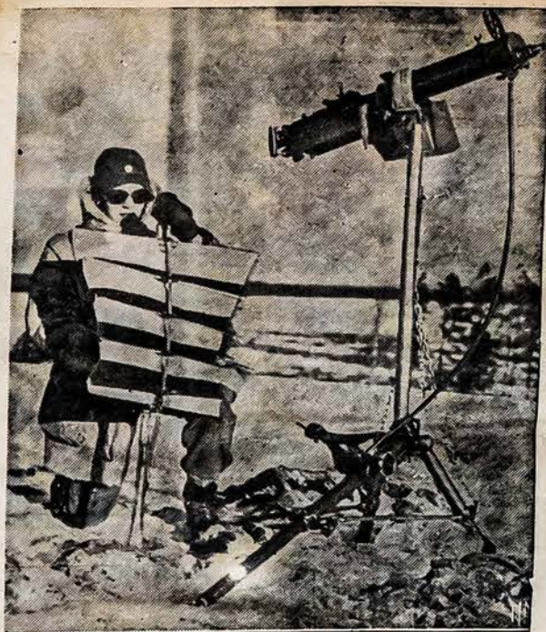
ŠVEDAI PASIRENGĖ KARUI Tai šitaip švedai ruošiasi pasitikti netikėtus svečius, rusiškus bolševikus, kurie šiandien jau veržiasi Suomijon. Švedas turi aukštai pakeltą kulkosvaidį, signalo aparatą ir nuo šalčio ir snie- go akinčius. Jis laukia priešio pasirodant.