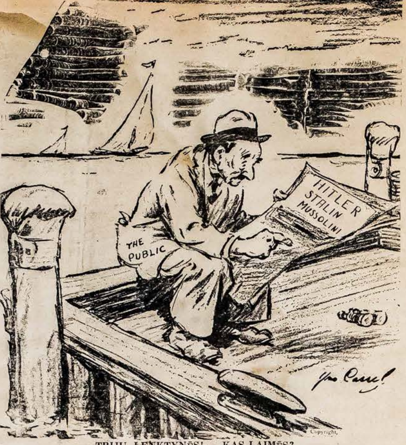
TRIŲ LENKTYNĖS! — KAS LAIMĖS?

tiktai karui pasibaigus sprestas prie taikos staltiesios kraštų žmonės turėjo iškovoti politinę priklausomybę, tačiau tamėjo. Tantai netenka baimitis dabar del skandalingų sąlygų. Karbus baigtas, Baltijos žmonių atstovai bus prie taikos stalo, turė progų negu turėjo pravo nepriklausomybių apmes nežinome, kuriam talkininkai ar jų jūm karą laimės. Mes esm manyti, kad šis karas kad jis gal baigsis visiš irime, anarchijoje, an kad pergalės gal nest kininkai ir jų opon musų spėjimas teising met susidarytų palab gos Baltijos kraštams. Jeigu karą laimės tai laimės ir lenkai, vėl gal bandys atnapi imperializmo politik mes abejojam jog onas ir ponias angliai karą laimėję imperializmą taip kaip zė iš koncent praecityje po pereito mas iš traukin jie dabar žino, kad perializmas rytų Eur rė sąlygas šiam karui.