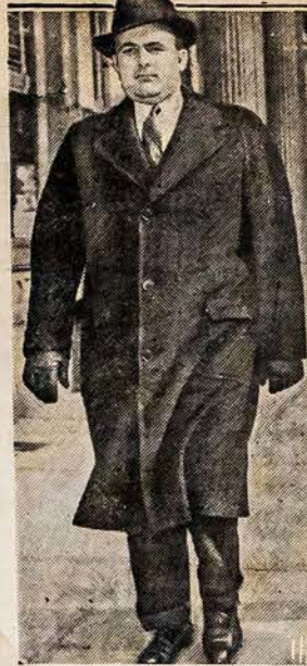
PULK. PRIEŠ TEISMĄ

AMERIKOS LIETUVIO SPAUSTUVEJE ATLIEKA VISOKIOS SPAUDOS DARBUS