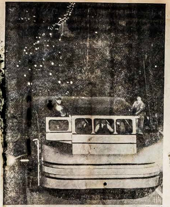
Admirolo Byrdo 27-nių tonų skraiduolis važiuoja pro Framing-hamą, Mass. po 10 mylių į valandą. Su savo tokiu važiuoimu su-trukdė 70,000 automobilių kely. Šitas sniego skraiduolis jau iš-gabentas Arktiko vadenyno tyrinėjimo tikslams.