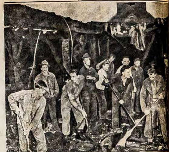
GAISRAS KAREIVINĖSE J. V. Pėstininkų 16-tas pulkas daro tvarką po gaisro, kurė 1,500 kareivius iš savo trijų aukštų iš akmenų ir statytų kareivinių, Governors saloje, aukštesnėje New Jlandkoje. Šios kareivinės yra antros didžiausios šioje