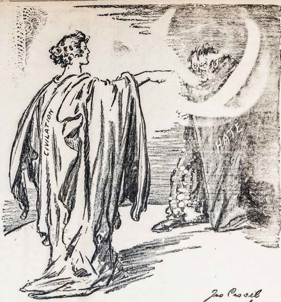
Priešas Numerio Pirmo

"Pagaliau, balansuojant Lietuvos-Lenkijos santykius po ultimatumo, tenka išskirti ir svarbiausia pozicija — Vilniaus krašto likimas. Palikti p.p. Bocianskių ir Klopotoskių globai, Vilniaus krašto lietuviai, be išdaulytų Vilniaus lietuvių organizacijų ir Vytauto Didžiojo gimnazijos bustinių langu, kitų apčiuopiamųjų ultimatumo, padiktuotų lenkų "geros širdies", pasekmių nepatyrė! Lietuviškosios mokyklos ir visokeriopsos lietuviškos organizacijos kultūrinio ir ukiškojo pobūdžio, po senovėje lieka uždarytos ir likviduojamos uolių kuratorių taip, kad kartais net nepakanka pinigų jų algoms apmokėti; Vytauto Didžiojo vienintelė lietuvių gimnazija Vilniuje negauna teisių, nes, anot Varšuvos švietimo ministro, tatau priklauso ne nuo jo, bet... nuo Lenkijos užsienio reikalų ministro. Net Lietuvos Mokslo Draugijos, kurios nederiso liesti net rusų caro valdžia, visas turtais ir lietuvių aukų ir triuso sudarytas kultūrinis lobis lieka konfiskuotas! Bergždžia būtų čia kartoti visi tie taip plačiai žinomi skaudūs faktai iš Vilniaus lietuvių gyvenimo, kurie prisidengiant retoristomis dėl tariamojo lenkų persekiojimo Laisvoje Lietuvoje, kurio nebuvimu turėjo geros progos įsitikinti tie blaivūs lenkai žurnalistai ir šiaip Lenkijos piliečiai, kurie taip gausiai viešojo siemet vasarą Laisvoje Lietuvoje, tie faktai, kurie tarsiomis dienomis tepa lenkų viešpatavimo Vilniaus krašte pokarinė istorijos puslapis! Viskas liko, kai buvė prieš ultimatumą!"