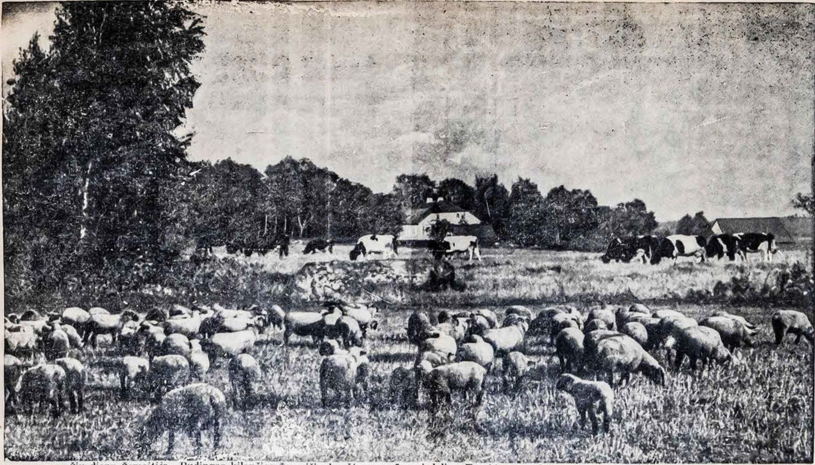
Šių dienų žemaitija. Budingas kilančios žemaičių krašto gerovės vaizdelis. Tvarkingos sodybos palaukėse — žemaičių apskrityj.