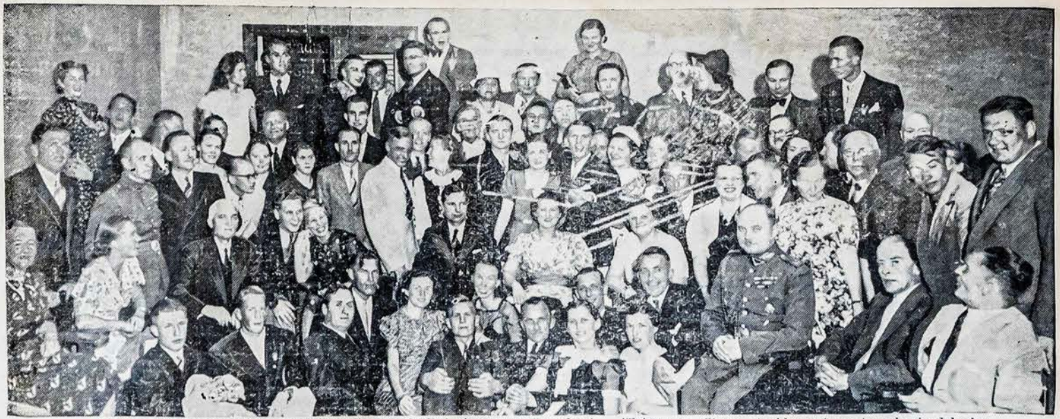
Lietuvos Seimo prezidiumas rugpjūčio 8 d. užsienių lietuviams suruošė pobuvį — išleistuves. Siame atvaide matome to pobuvio dalyvius.