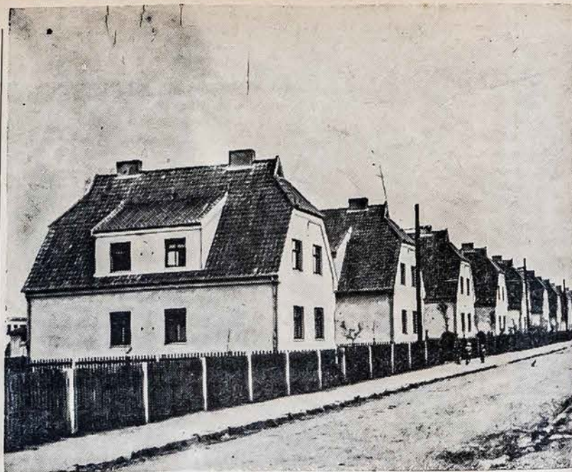
Klaipėdos Naujoji Statyba