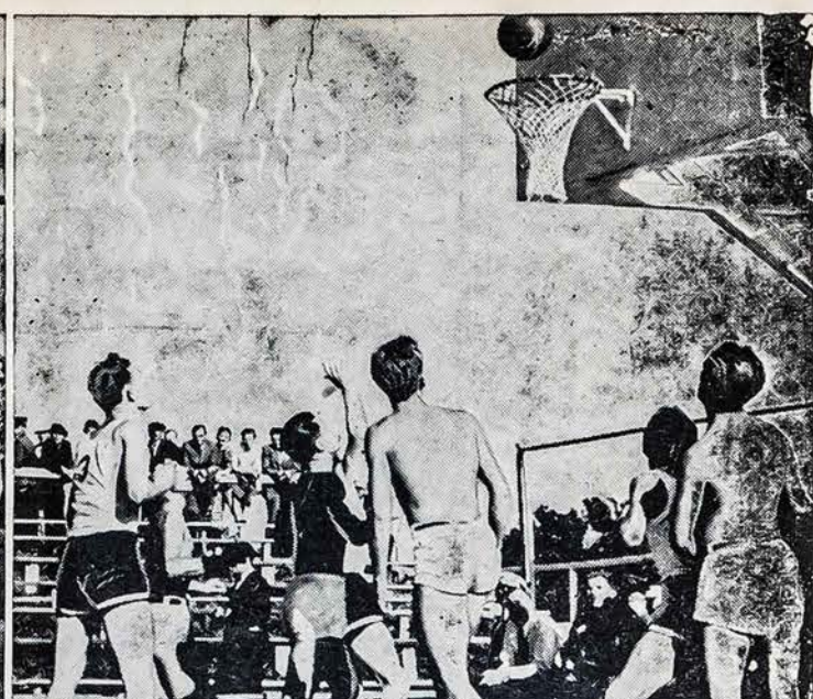
Iš tinklinio ir krepšinio rungtynių. Kairėje—vyrų tinklinio pusfinalis CJSO—Vilniečiai (visi balti); dešinėje—krepšinio rungtynės tarp Grandies ir šiaulių Sakalo.